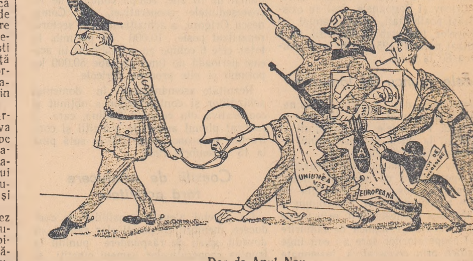
desen de Kukrincic Dar de Anul Nou (din ziarul Pravda)