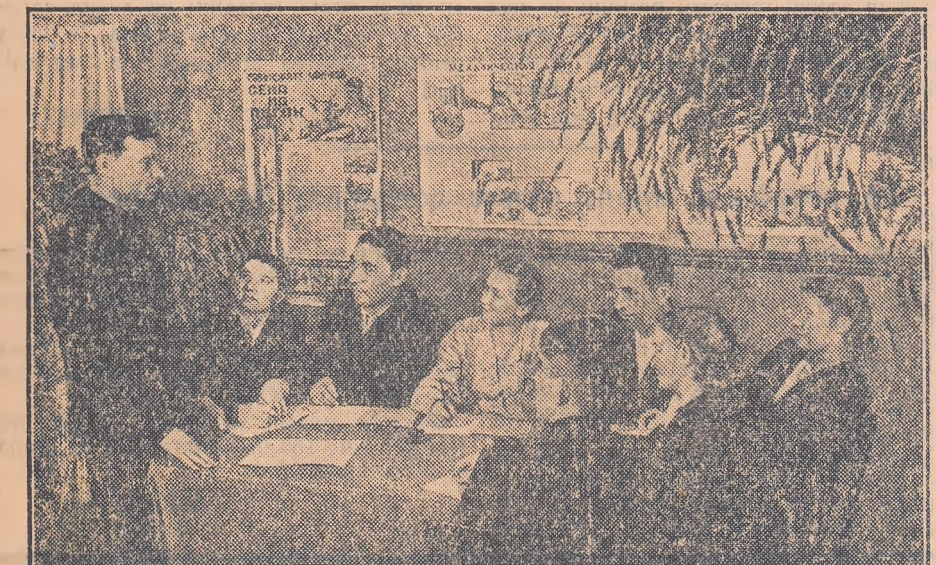
Pentru a fi cât mai bine înțelese și însușite lecțiile ce se predau la cursurile agrozootehnice triennale, lectorii folosesc un bogat material demonstrativ.

Cursurile sînt frecventate de specialiști în cultura bumbacului, crescători de animale, viticultori și de alții. La aceste cursuri sînt înscrși în total 63.000 de oameni. Lecțiile se țin după terminarea orelor de lucru. Colhoznicilor li s-au pus la dispoziție în mod gratuit manuale și materiale didactice.