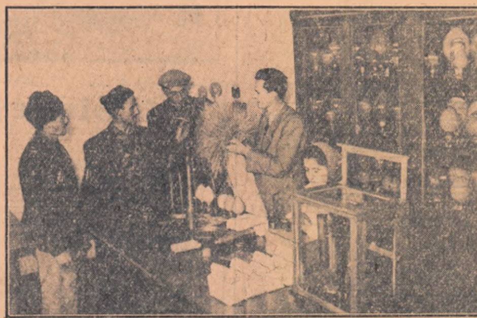
Țăranii muncitori din împrejurimile stațiunii experimentale I.C.A.R. Valul lui Tralan, raionul Medgidia, vîd deseori ecl să se intereseze de cercetările și rezultatele obținute de agronomi. In fotografie: un grup de colectivizist primind explicații cu privire la caracteristicile solurilor de plante ralionate, pe care vor să le însămînțeze primăvara aceasta.