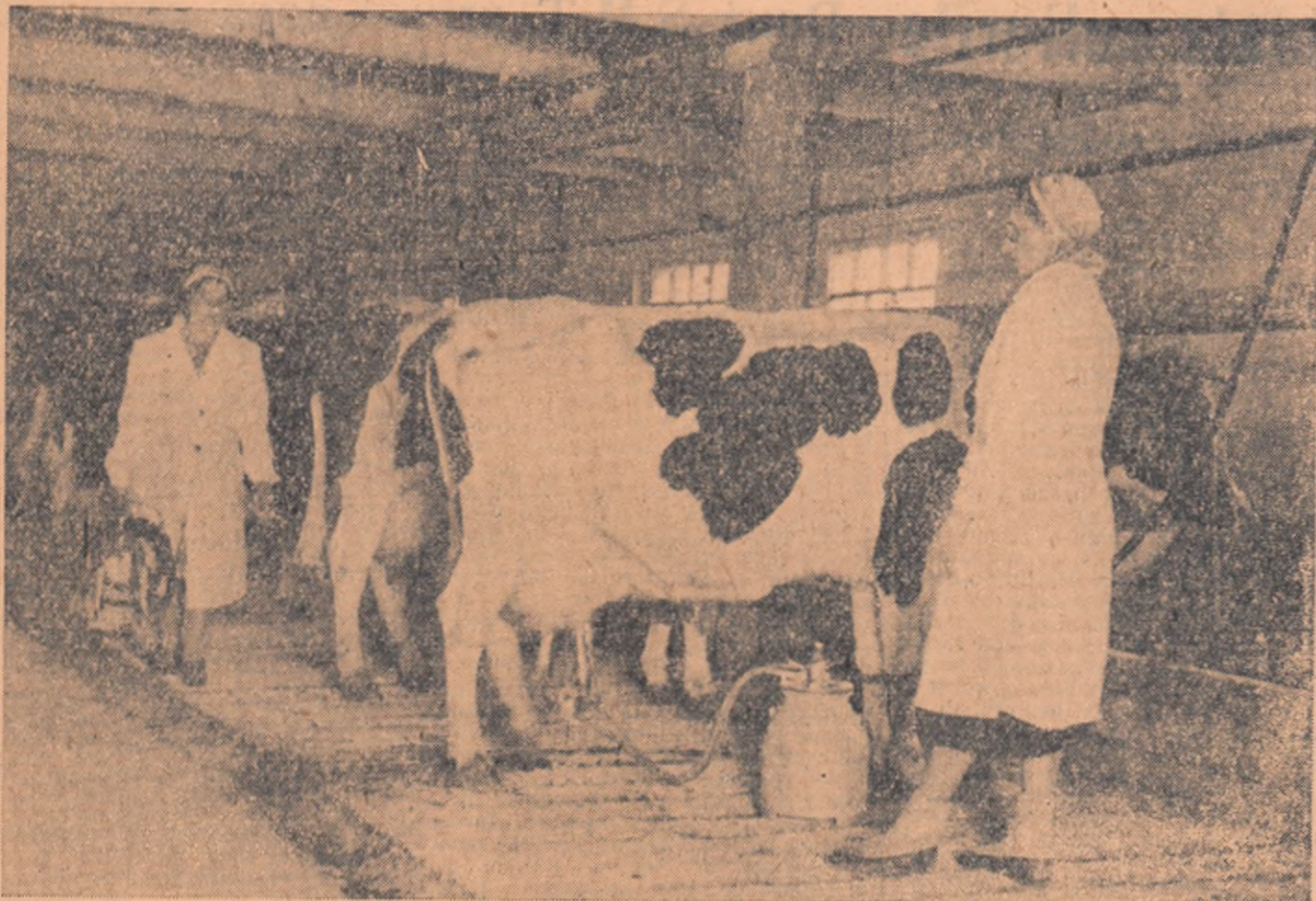
Interiorul unui grajd din colhozul „Stalin” din împrejurimile Moscovei, unde principalele lucrări sînt mecanizate