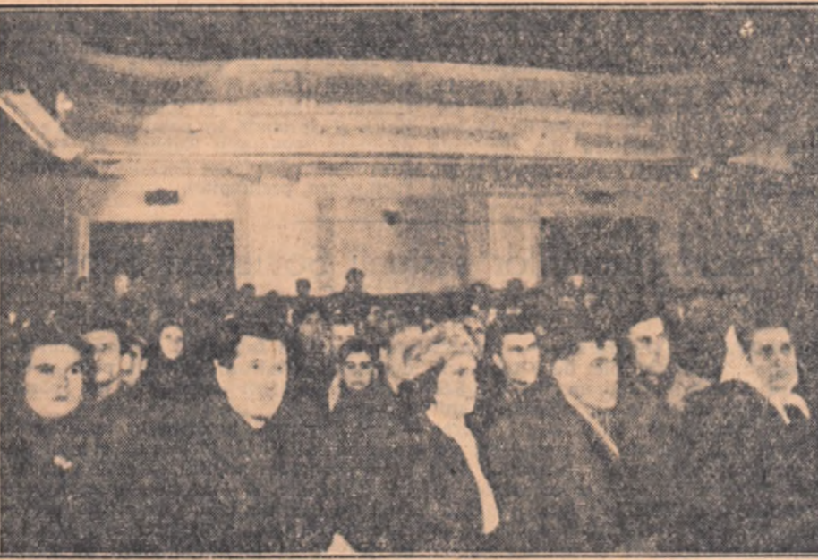
Aspect din sala unde a avut loc consfătuirea

În scopul răsplinderii metodelor înaintate de creștere a animalelor, cât și a rezultatelor ce se obțin prin aplicarea lor, la gospodăria agricolă de stat din Chirnogi, regiunea București, a avut loc o consfătuire cu zootehniștii și crescătorii de animale fruntași din regiune. La această consfătuire, organizată de comitetul regional P.M.R. București, statul popular al regiunii București și revista „Știință și Tehnică”, au participat peste 300 de crescători de animale din unitățile agricole socialiste și din sectorul individual, numeroși ingineri, tehnicieni și medici veterinari. Au luat parte de asemenea reprezentanți ai Ministerului Agriculturii și Silviculturii, al Institutului de cercetări zootehnice, al C.C. al Sindicatului muncitorilor agricoli, precum și unii crescători de animale fruntași din alte regiuni ale țării. Redăm unele probleme ridicate în cadrul consfătuirii, precum și sarcinile importante și imediate ce stau în fața crescătorilor de animale din regiunea București, în vederea înnulțirii șeptelului și creșterii unuia belșug de produse animale necesare îmbunătățirii aprovizionării populației.