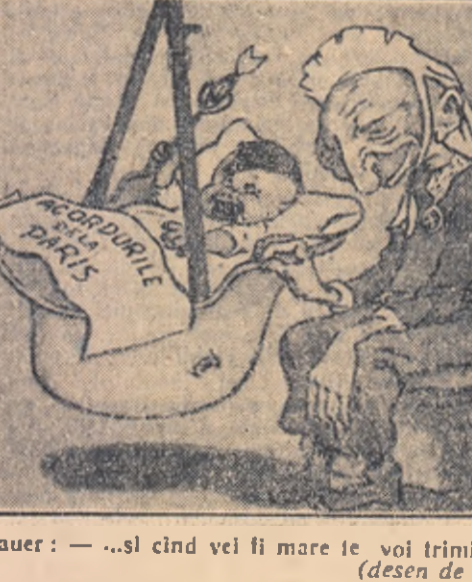
Adenauer: — „...și cînd vei fi mare te voi trimite la Paris!

În ultimul timp, pentru a fi și mai mult pe placul stînjitorilor din S. U. A., Adenauer și-a luat îndrăzneala să facă o serie de declarații care nu pot să nu stîrnească îngrijorare în rîndul popoarelor ale căror guverne au semnat acordurile de la Paris. Aceste declarații nu se deosebesc cu nimic de declarațiile pe care le făceau Hitler sau Göring. „Înarmarea Germaniei occidentale trebuie începută neîntîrziat... Cea mai bună apărare a nației constă într-o înarmare foarte puternică...” Acestea sînt doctrinele cancelarului. Mai mult, el își peremite să atragă atenția Franței să nu îndrăznească cîmșva să repete ceea ce a „făcut cu tratatul „comunității defensive europene”. O fi sîntăz frumusețe aceste declarații pentru guvernantii S.U.A. și ai Angliei, dar pentru popoarele Europei și pentru onorul german sună a știriet de o buze și bombe.