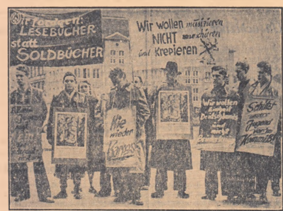
Tineretul muncitor din Düsseldorf (Germania occidentală) demonstrează împotriva refacerii mașinilor de război hitleriste.