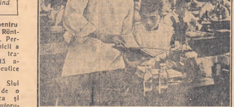
Unul din preparatorii Institutului veterinar din Lancijou ajutîndu-l pe studenți în timpul lucrărilor practice.

Văzut caflrul însănătoșit, a spus emoționat: „Credeam că pentru salvarea caflrului meu va trebui să cheltuiesc cel puțin 2 milioane yuani”, totuși tot tratamentul m-a costat numai 200.000 de yuani”. Clinica veterinară din Lancijou a salvat de la moarte în decurs de 5 ani un mare număr de animale domestice, a căror valoare depășește 10 miliarde yuani. Personalul de deservire al clinicii veterinară pleacă adesea în diverse raioane pentru a trata animalele, pentru a le face inocuări antiepidemice și pentru a da consultații. Iată pentru ce populația vorbește cu multă recunoștință despre oamenii care deservesc această clinică veterinară. *) Preturile sînt scoțite în moneda dinainte de recența stabilizare.