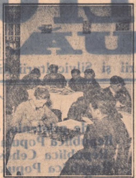
Mecanizatorii de la S.M.T. Podoleni, regiunea Bacău, au posibilitatea să-și petreacă orele libere în mod plăcut și instructiv. Iată-i pe tractoriștii în sala frumos amenajată a clubului stațiunii citind cărți și jucînd șah.