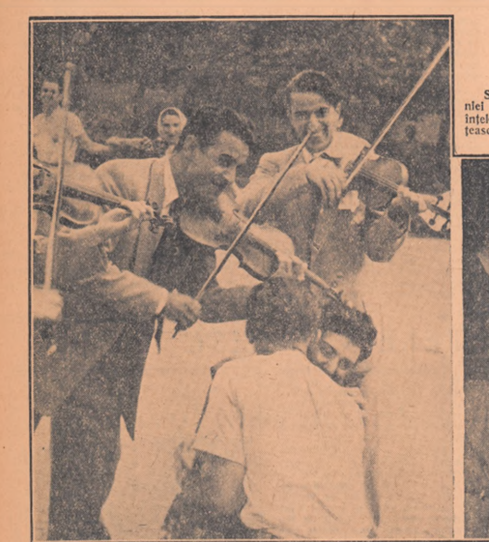
Asesmenii clipe vor rămâne neșterse multă vreme după Festival. Cercul horei se mărește și pînă la urmă va cuprinde toată piața. Doar vadă că „Perinița” se bucură de o largă popularitate.