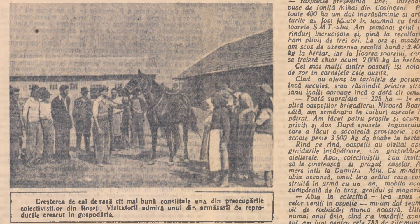
Creșterea de cal de rasă cit mai bună constituie una din preocupările colectivizatorilor din Rosești. Vizitatorii admiră unul din armăsarii de reproducție crescut în gospodărie.

Prin frunzișul încă verde și des al copacilor din ograda gospodăriei colective, lumina soarelui se strecura asemenea unor fire delicate de pang. Razele încăușă și calde luminau fețele proaspăt bărbierite ale bărbaților, intrîndu-se cu ușurință în ochii și în urechi și se aplecau pentru a nenumărate înjurături, sau mingia obrazul de pierșică a unei codane. Așezați pe băncile înșirate în curte, La asemenea cuvinte, toți cel de față — gazde și oaspeți laolaltă — au ris cu lacrimi. Mai tare ca toți, rîdea chiar Marin Popia, cel cu istoria. Numai a dumisale nevastă rămintă un capăt al șorului și țare ar fi vrut să se aplece pentru o clipă la mare depărtare de acest loc. Acum, se gîndea președinta, așteptînd să se potolească hazul oamenilor, după ce