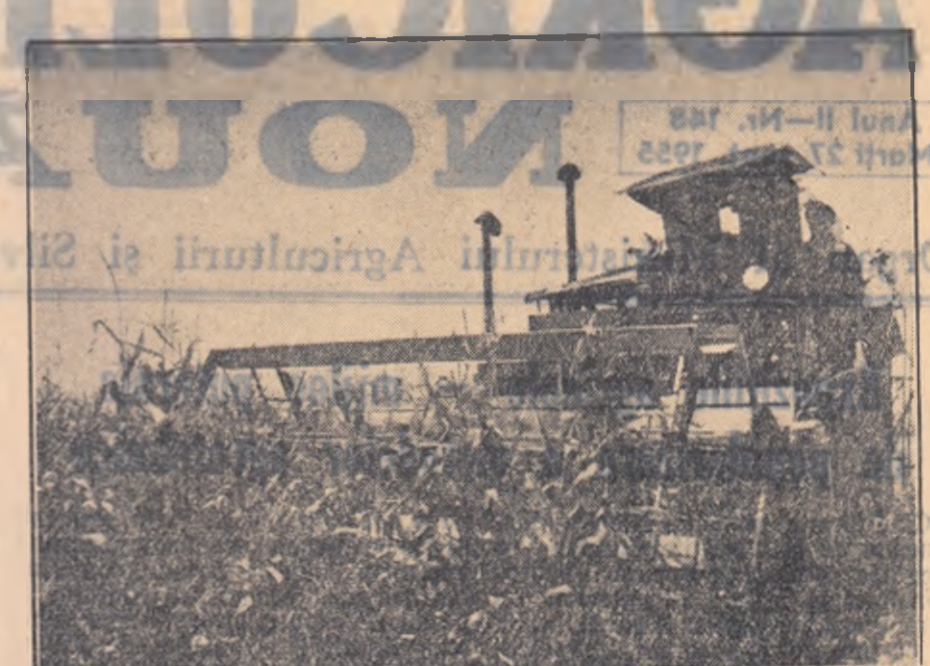
La atelierul mecanic al gospodăriei de stat Aradul Nou, Inginerii și tehnicienii au adaptat o combină S. 4 pentru recoltarea porumbului furajer. Iată-l în fotografie pe combinierul Motocea Vasile, lucrînd la recoltarea porumbului de furaj.