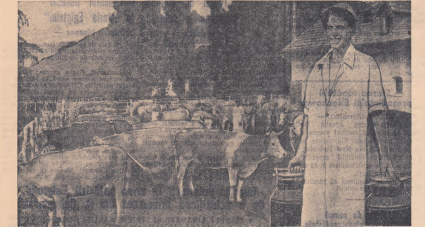
La gospodăria agricolă de stat „Gheorghe Cosbuc” din Medias, se acordă o deosebită atenție dezvoltării sectorului zootehnic. Pentru hrana animalelor pe timpul iernii au fost însoțite peste 100 de vagoane de porumb în faza de coacere lapte-cesară. În fotografie: Mulgătoful Mîldt Ion are de ce să fie mulțumit. El obține zilnic de la fiecare vacă peste 24 de litri de lapte.