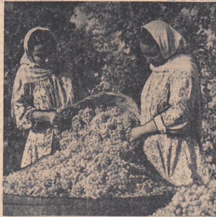
În R.S.S. Azerbaidjan s-a obținut anul acesta o bogată recoltă de struguri. În fotografie: aspect de la culesul strugurilor în colhozul „Nizami” din raionul Tauszk.

Construcția combinatului urmează să fie terminată pînă la sfîrșitul acestui an. În prezent, se desfășoară lucrările de finalizare a încăperilor și montarea utilajului din prima etapă.