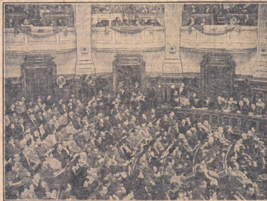
Un aspect din sala Congresului

Lucrările Congresului au luat sfîrșit într-o atmosferă de mare entuziasm. Delegații și invitații la Congres au manifestat îndelung pentru noi succese în activitatea viitoare a A.R.L.U.S.-ului, pentru prietenia de neînfrîncat dintre poporul român și marea popor sovietic, constructor al comunismului.