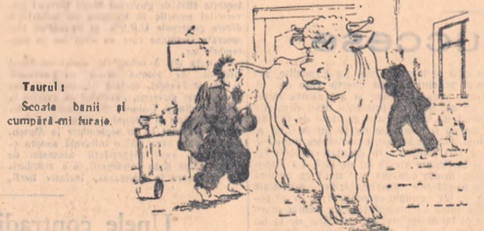
Taurul scoate banii și cumpără-mi furajă.

Președintele Comitetului Executiv al Statului popular din comuna Mărcănești a dat dispoziție ca pe 3 hectare din lotul zootehnic să se cultive zarzavaturii. El și-a însușit suma de 2.000 de lei cvenită statului popular drept chirie pentru acest teren.