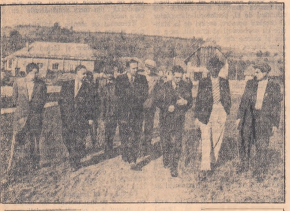
Delegatia sovietică care ne vizitează țara în cadrul Lunii prieteniei romino-sovietice a vizitat zilele trecute G.A.C. „Partizanul Roșu” din comuna Curteni, raionul Tg Mureș.