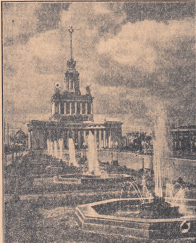
Pavilionul central al expoziției

În cele 26 de săli și 12 platouri ale pavilionului „Mecanizarea și electrificarea agriculturii” sunt expuse peste 1.200 de mașini și unelte de diferite tipuri, folosite azi în agricultura Uniunii Sovietice. În interiorul uriașei săli a pavilionului, sunt expuse tractoare de diferite tipuri: tractoare cu gazogen, care folosesc lamul și turba drept combustibil; tractoare universale ce roți de tinut „Biotras”, M.T.Z. etc. folosite azi cu deosebit succes în agricultura țării noastre.