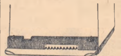
Inchizătorul de urdiniș prevăzută cu grătie apărătoare contra pătrunderii soarecilor în stup.

Înainte de a arăta care sînt îngrijirile ce trebuie date albinelor în timpul iernii, să vedem cum trăiesc ele în acest anotimp. Cînd temperatura scade sub 13 grade, albinele încep să-și formeze „ghemul de iarnă”. Pentru a lupta împotriva frigului, ele se strîng unele în altele, de fapt, formînd un ghem în interiorul căruia, în tot timpul iernii, temperatura nu scade niciodată sub 14 grade. Albinele de la exterior sînt mai îndesate una în alta, formînd o coajă cu grosimea de 2—7 cm. Miezul ghemului este alcătuit din albine