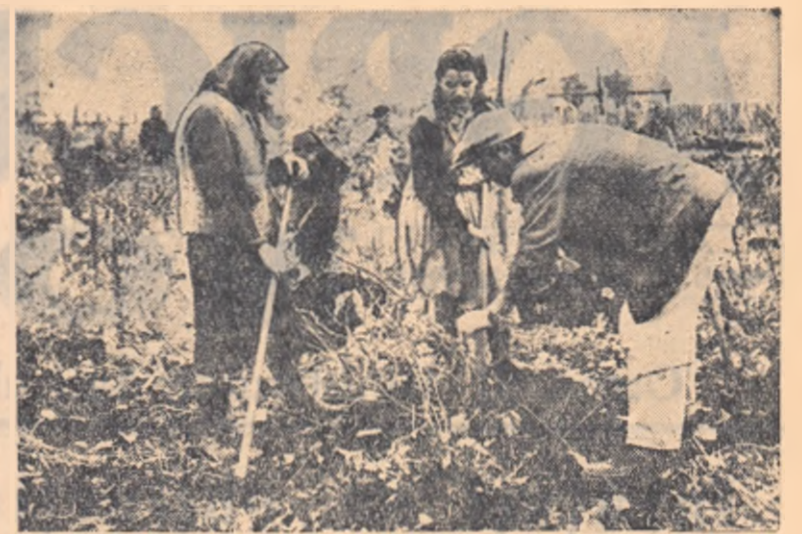
La G.A.S. Săbăteni, raionul Mizil, îngropatul viei este în to. Din cele 38 de hectare de vie, care sînt îngrijite de brigada a II-a, 27 au și fost îngropate.

Țăran muncitor din comuna Prejmer, regiunea Stalin.