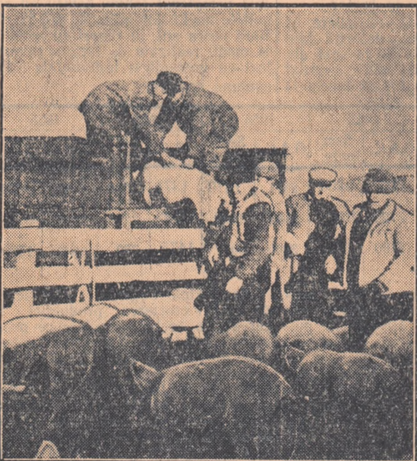
Un nou transport de animale de rasă pentru gospodăriile colective din regiune.

Amara și Ibranu sînt două comune învecinate din raionul Filimon Sirbu, 29 de familii din Ibranu și 22 de familii din Amara au întemeiat de curînd două gospodării colective. În semn de dragoste și recunoș-