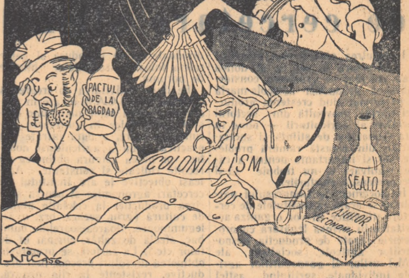
Un bolnav fără leac

Inștiințare: Se aduce la cunoștință absolvenților Institutului Agronomic Iași că în 20 februarie—4 martie a.c. are loc Examenul de Stat la acest institut. Conform ordinului Ministerului În-vămîntului nr. 2609/1955, absolvenții din seriile 1943—1954, care nu s-au prezentat niciodată la examenul de stat ori s-au prezentat o singură dată pot susține Examenul de Stat la data din sesiunile anului 1956.