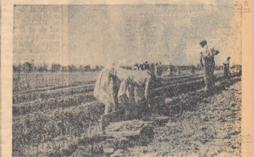
Plantatul vițelor altoite în școala de viță a gospodăriei agricole de stat Zăbrani, regiunea Timișoara.

La G.A.S. Teremia Mare, a spus vorbitorul, este o școală de viță pe o suprafață de 40 ha. În fiecare an se altoiesc aici peste 6 milioane de vițe. Pentru a rezolva problema asigurării brațelor de muncă și a spațiului de forțare, în această gospodărie s-a trecut la contractarea tuturor lucrărilor cu țărani muncitori viticultori, pe baza H.C.M. 639 din 1954. În felul acesta s-au asigurat în întregime brațele de muncă necesare, începînd de la altoire și pînă la recoltare. De asemenea, a fost rezolvată și problema spațiului necesar forțării vițelor, deoarece cea mai mare parte din contractanții fac această lucrare în gospodăria proprie. Fîind interesați, contractanții au respectat întocmai îndrumările tehnicilor, au executat toate lucrările de bună calitate și la un înalt nivel agrotehnic, ceea ce a făcut ca producția de vițe altoite să fie cu 455.167 bucăți vițe de calitate întîia și cu 357.914 bucăți de calitate a doua mai mare decît prevederile planului.