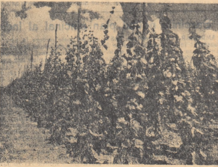
Vedere din plantația de portaltoi toale de la gospodăria agricolă de stat Drăgășani.

Acordîndu-se toată atenția acestor măsuri, li se va putea produce o cantitate sporită de material săditor viticol de bună calitate — condiție importantă pentru refacerea și dezvoltarea patrimoniului viticol din țara noastră.