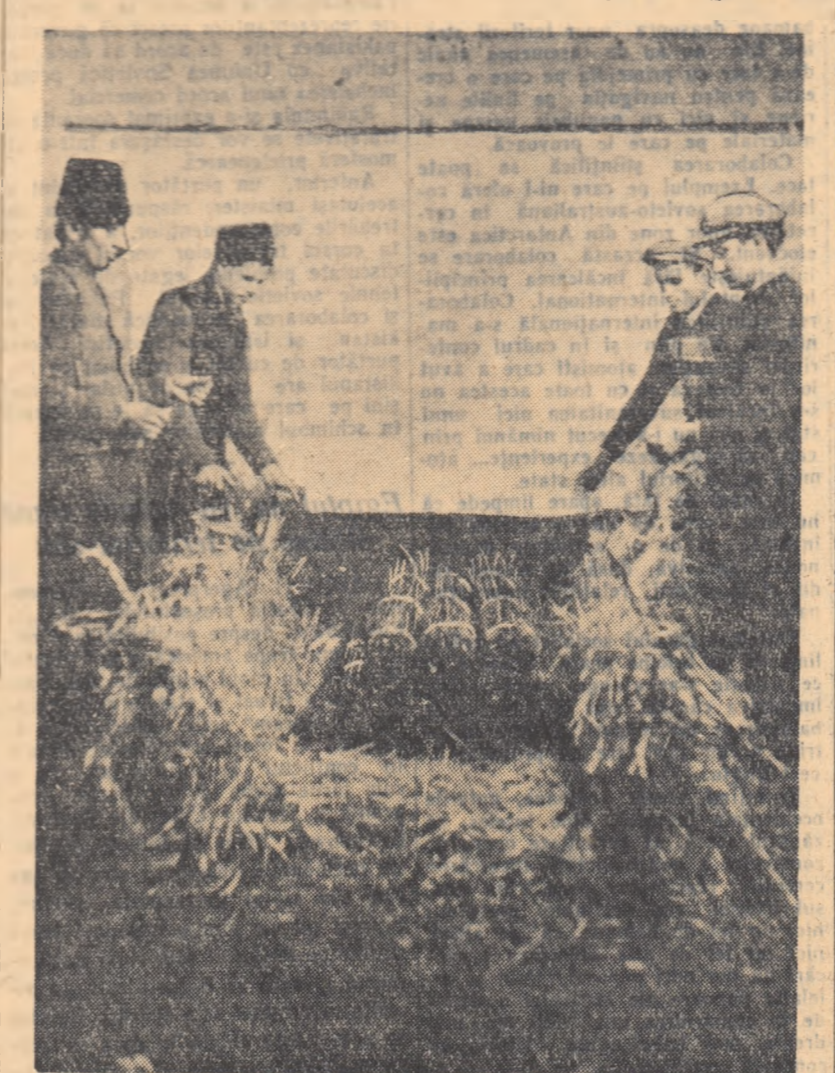
Aspect din munca de ambalare a butașilor portaltoi de la stațiunea experimentală Drăgășani.

Fundul lăzii se cîntuștește cu un strat de paie uscate de 5 cm grosime, peste care se așază un strat de rumegus umez în grosime de 5 cm. Peste rumegus, se așază un rînd de vițe, apoi peste vițe un strat de rumegus; operația se continuă în felul acesta pînă la umplerea completă a lăzii. Se calcă apoi conținutul lăzii, pentru ca vițele să fie cît mai bine așezate, iar volumul cîștigat se completează în felul arătat mai sus, avînd grijă ca la umplerea completă deasupra să fie un strat de rumegus și paie. Peste acestea, se toarnă uniform 30-40 litri de apă, apoi se fixează capacul pe care se scrie desicribabil adresa, gara de destinație, soiul și numărul de vițe ambalate.