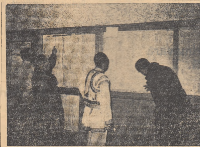
În aceste zile premergătoare alegerilor, în satele patriei noastre, ca și în orașe, se desfășoară o vie activitate electorală: la casele alegătorului cetățenii lău parte la întîlnirile cu candidații lor și verifică listele de alegători.

În clîșeu: țărăni muncitori din comuna Boroaia, raionul Fălticeni, regiunea Suceava, controlînd dacă au fost înscriși în listele de alegători.