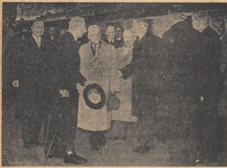
La sosirea în gara Victoria din Londra conducătorii sovietici au fost întâmpinați de primul ministru al Angliei, Anthony Eden, ministrul de Externe, Selwyn Lloyd, alți miniștri și membri ai corpului diplomatic.