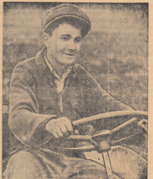
Pentru mecanizatorii de la S.M.T „1 Mai” Brăila, ca și pentru toți oamenii muncii din patria noastră, a devenit o tradiție de a întîmpina în fiecare an măreața sărbătoare a solidarității oamenilor muncii de pretutindeni cu bogate realizări în muncă. Și în anul acesta, cu toate că primăvara a venit mai trziu ca de obicei, mecanizatorii stațiunii ce poartă numele zilei de „1 Mai” au reușit să obțină fru- moase succese în cîntea marilor sărbători. Pînă la 24 aprilie, brigă- zile de tractoare ale stațiunii și-au îndeplinit sarcinile de plan pe cam- pania de primăvară în proporție de 60 la sută.