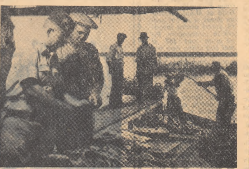
Nu numai cantitatea, ci și calitatea, respectiv solul de pește crescut în bălta, îl interesează pe colectivități.

I. LUSTUN de la Institutul agronom „N. Bălcescu”