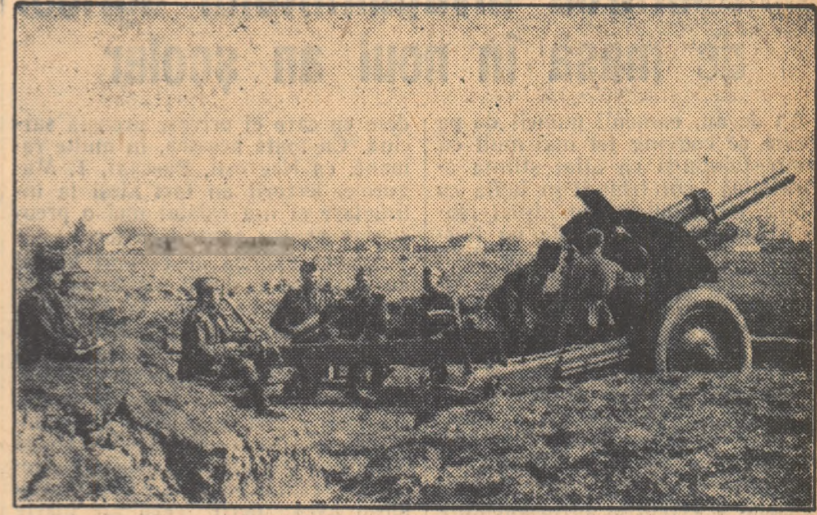
In curind, proiectilul își va lua zborul. Iar peste câteva clipe, comandantul va anunța spre satisfacția tunarilor: „Mansă distrusă”.