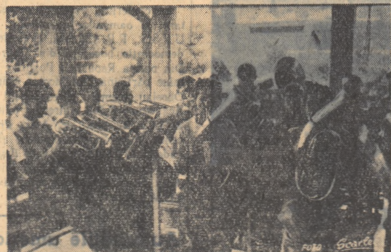
În timpul unei repetiții