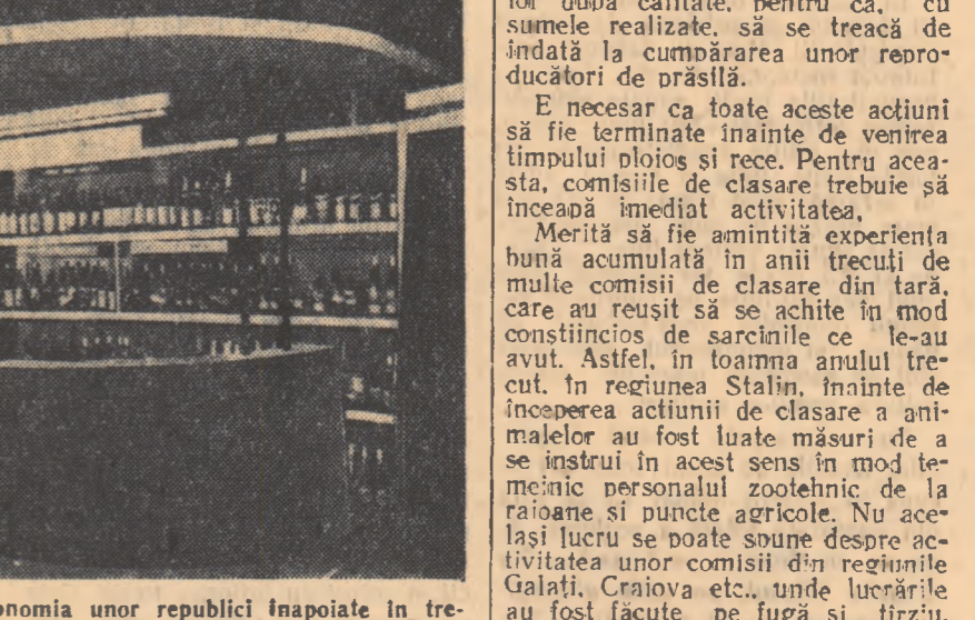
În anii puterii populare, economia unor republici înnoapate în trecut, ca Macedonia ori Munteguru, a făcut mari progrese. În fotografie: un frumos stand al expoziției, înfățișînd produse ale industriei alimentare din Macedonia.

În niste standuri speciale au fost expuse produse ale industriei chimice necesare agriculturii, precum și utilajele ale industriei pentru