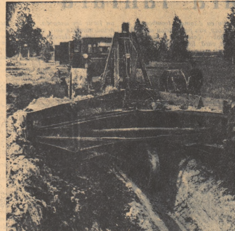
În multe regiuni ale Uniunii Sovietice sînt valorificate mari întinderi de pămînt. În fotografie: mecanizatorii de la stația de mașini și ameliorări din Piarna Lagupisk (R.S.S. Estonă) sapă canale cu ajutorul unui plug special pentru desecarea mlaștinilor. Astfel, vor fi date în folosință pămînturi aparținînd colhozului Kirov.