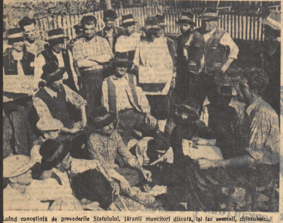
Luînd cunoștință de prevederile Statutului, țărani muncitori discută, își fac secolii, chibzuiască.

Dacă tovarășii din conducerea stațiunii s-ar deplasa mai des pe teren, ar afla fără îndoială că unii agronomi de sector, în loc să scrie în efectivele brigăzilor, stau mai mult prin sate, pe la prieteni, sau își văd de diverse interese personale. De asemenea, ar afla că atelierul mobil al S.M.T.-ului, cînd nu stă în ogradă stațiunii, poate fi văzut în comune... În fața bufetelor, în loc să fie pe teren, la brigăzi, pentru a ajuta la înlăturarea numeroaselor defecțiuni în vite la tractoare.