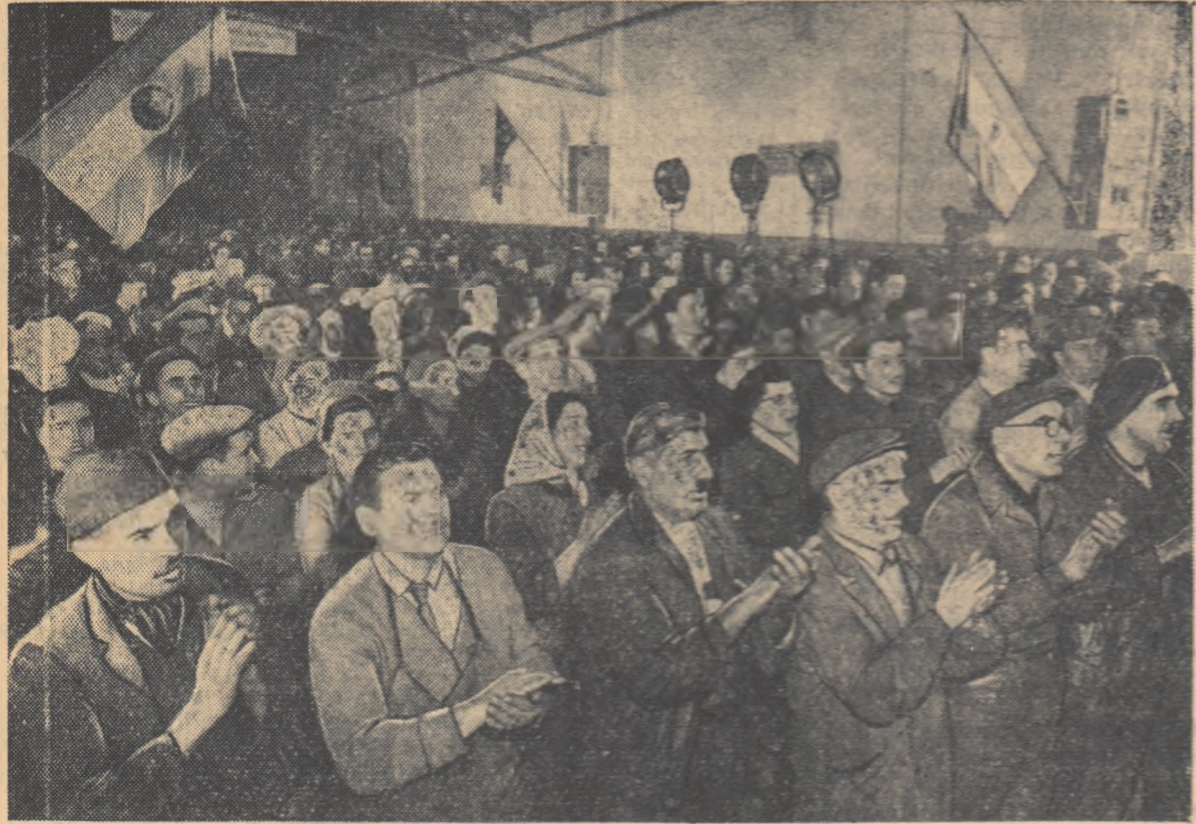
Adunarea cetățenească de la Complexul C.F.R. „Grivița Roșie”

Tovarășul GHEORGHE GHEORGHIU-DEJ propus candidat al F.D.P. în circumscripția electorală nr. 30 Grivița Roșie