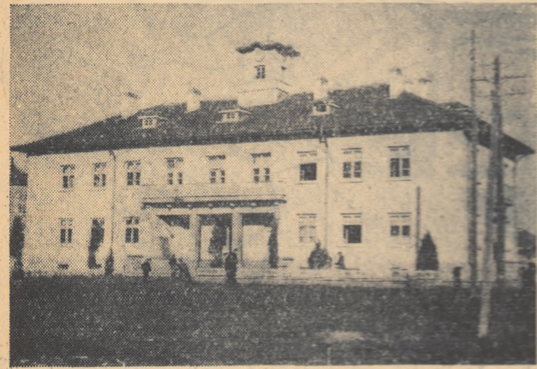
Frumoasa clădire a statului popular sârbesc din Komsomol, construită în ultimii ani.