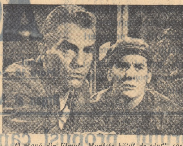
O scenă din filmul „Muntele bătut de vînt”, care va fi prezentat în cadrul Festivalului.

De cîteva zile, în întreaga țară se desfășoară festivalul filmului pentru sate. În localitățile cu cîntărituri agricole de stat, gospodării colective și S.M.T.-uri, vor rula pe bandă normală filme artistice și documentare legate de viața satului. În același timp, caravanele cinematografice vor cutreiera satele, prezentînd spectatorilor de aci un număr de filme artistice, documentare și jurnale agricole mult mai rare decît în anul trecut; în total, 226 peliule. Vor rula filme ca „Mîcîl lustrăgiu”, „Trandafirul lui Alah”, „Chitarele dragostei”, „Muntele bătut de vînt”; însă centrul de greutate îl vor constitui peliulele cu tematică agricolă „Călușii”, „Volnita”, „Desfășurarea” etc., precum și jurnalele „Reguliile efectuării aratului”, „Noi mașini agricole”, „Lucrări în vii” etc.