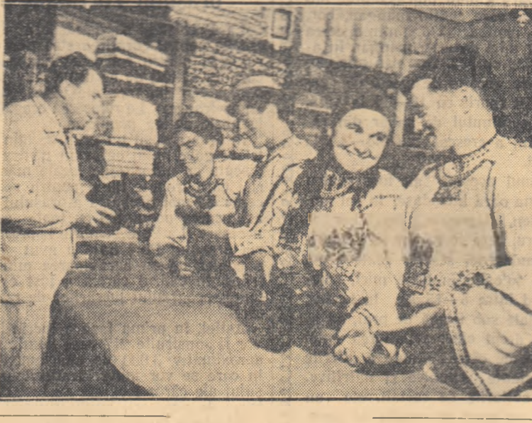
Aprovizionarea țărănilor muncitori din satele patriei noastre s-a îmbunătățit simțitor în ultima vreme. Totdeauna ei găsesc la magazinele sătești mărfuri frumoase și de bună calitate. În fotografie: un aspect de la unul din magazinele sătești din Țara Ouașului.