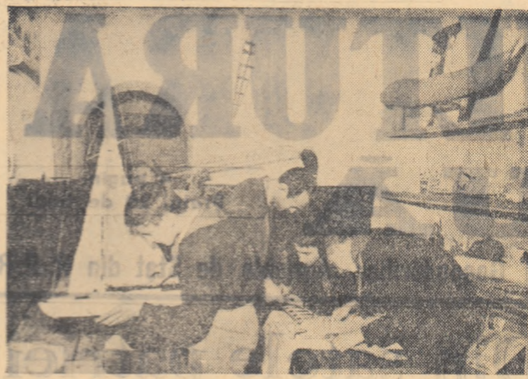
La casa pionierilor din Roșiori de Vede vin zilnic in timpul liber aenunțarii pionieri. Aici ei au posibilitatea să desfășoare in cadrul cercurilor de specialitate o activitate multilaterală. In fotografie: un aspect din activitatea cercului de aeromodellism.