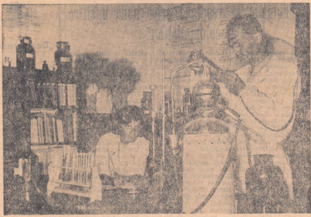
Pentru a-și aduce contribuția la sprirea producției, oamenii de știință din agricultură se străduiesc să găsească cele mai potrivite metode de lucrare a pămîntului...