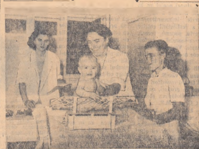
În anii regimului nostru democrat-popular, tot mai multe dispensare medicale și case de naștere au fost puse la îndemîna țărănilor muncitori.

Prin hotărîrile plenare C.C. al P.M.R. din 27 — 29 decembrie 1956 țărănimii muncitoare s-a putut încredința încă o dată de erica neclămirată pe care o poartă partidul. A putut vedea, că atunci cînd sint create condiții optime, partidul vine cu noi măsuri în folosul masei, că tot ce face partidul are unul izbîndit.