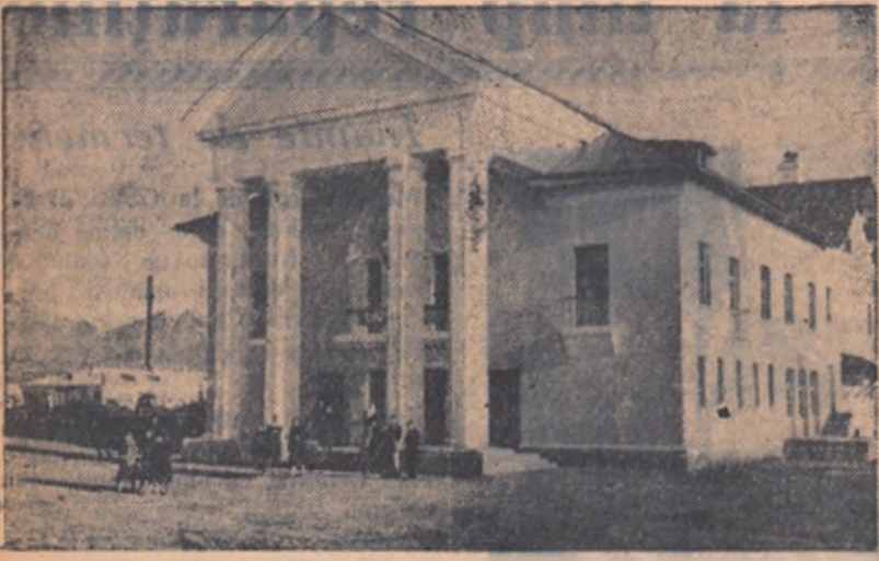
Casa de cultură nou construită a unui colhoz din R.S.S. Kazah.