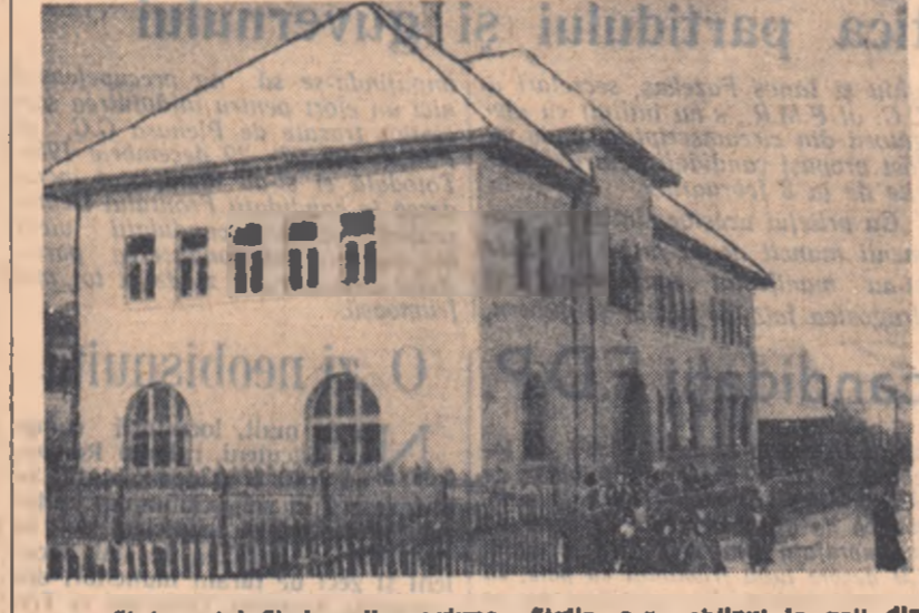
Și în acest școală din regiunea Stalin s-a obținut în anul din urmă o serie de realizări...