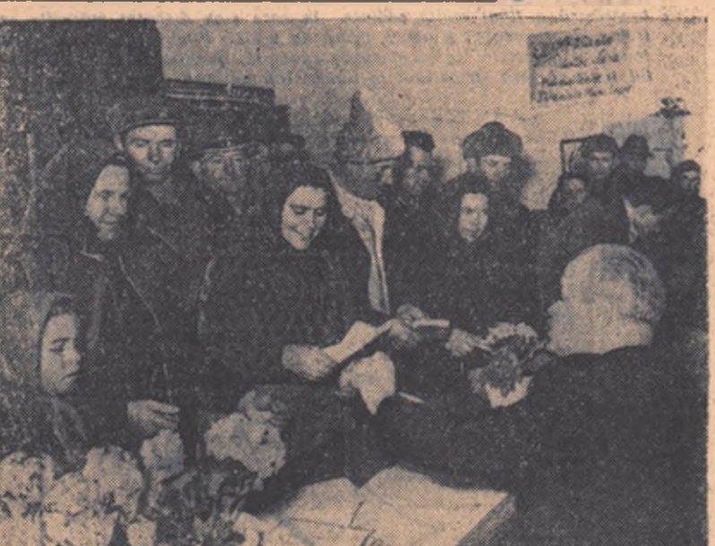
Țărani muncitori din comuna Popești-Leordeni, regiunea București, în semn de dragoste și atașament pentru partidul și guvernul nostru s-au prezentat la vot încă din primele ore ale dimineții.

În satul Ruja din raionul Agnita, a luat ființă în ajunul alegerilor prima cooperativă agricolă de producție cu rentă din regiune. În această cooperativă au intrat 21 de familii de țărani muncitori romîni, sași și maghiari.