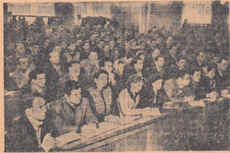
Un aspect din sală în timpul consfăturii.

— Pe marginea unei consfături pline de învățăminte —