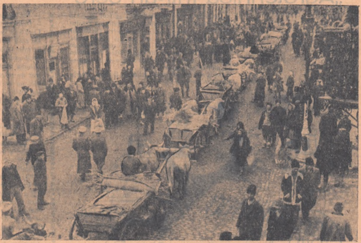
Convoinul de carute cu produse achiziționate de către cooperative, în drum spre baza de recepție