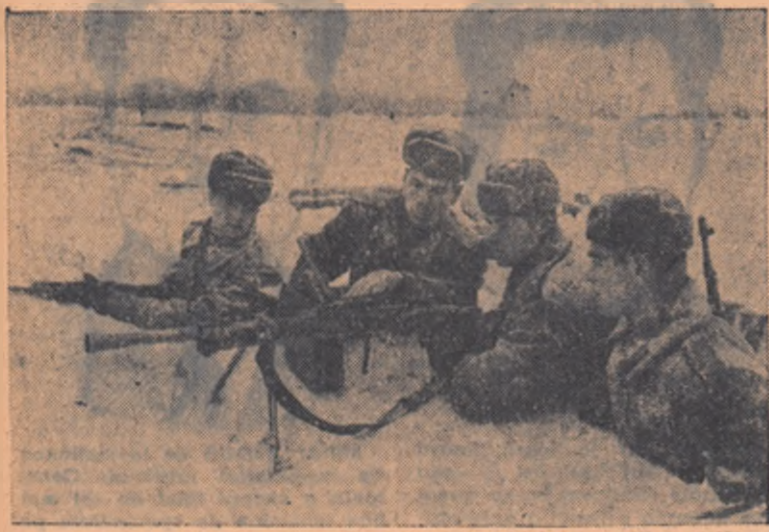
Ofițerul verfica arma în vederea targerii

În octombrie 1917 în Rusia a avut loc un eveniment de importanță istorico-mondială. Clasa muncitoare în alianță cu țărănimea muncitoare a înfrânt Marea Revoluție Socialistă din Octombrie. Ca urmare a acestui revoluționar a fost răsturnată puterea capitaliștilor și a moșierilor și s-a format statul sovietic — primul stat din lume al muncitorilor și țărănilor, conduși de partidul comunist. La 28 ianuarie 1918 V. I. Lenin a semnat decretul guvernului sovietic cu privire la crearea armatei roșii muncitorești-țărănești. La 23 februarie 1918, acum 39 de ani, unitățile tinerii armate roșii au oprit înaintarea armatelor Germaniei imperiale, care căutau să ocupe Petrogradul (Leningradul de astăzi), leagănul revoluției socialiste. Această zi a intrat în istorie ca Ziua Armatei Sovietice.