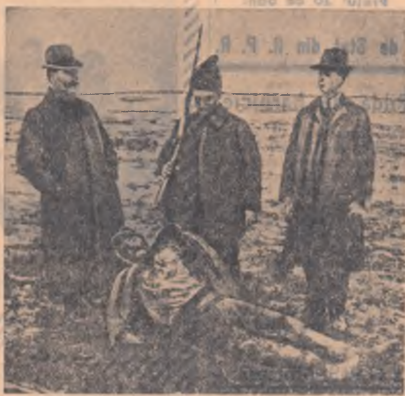
„Unul din cei 11.000. Fotografie luată lângă Roșiori de Vede, după împușcarea unui țaran din satul Pirlita (28 martie 1907) și publicată de revista franceză „L'illustration”.