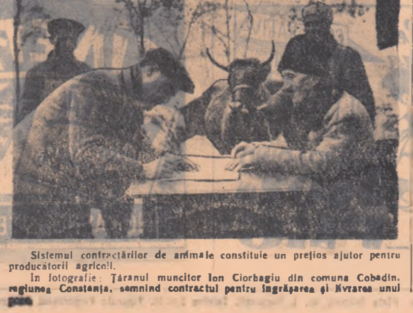
Sistemul contractărilor de armate constituie un prețios ajutor pentru producătorii agricoli.

În numărul 300 din 12 martie 1957 al ziarului nostru, la pagina 2 a coloana 5 a, înscind din rîndul 8 se va citi: „Administrația Asigurărilor de stat contribuie și la măsurile de prevenire și combatere a incendiilor și epizodurilor; anul trecut a pus la dispoziția satului populare în acest scop o sumă de peste 60 milioane lei”.