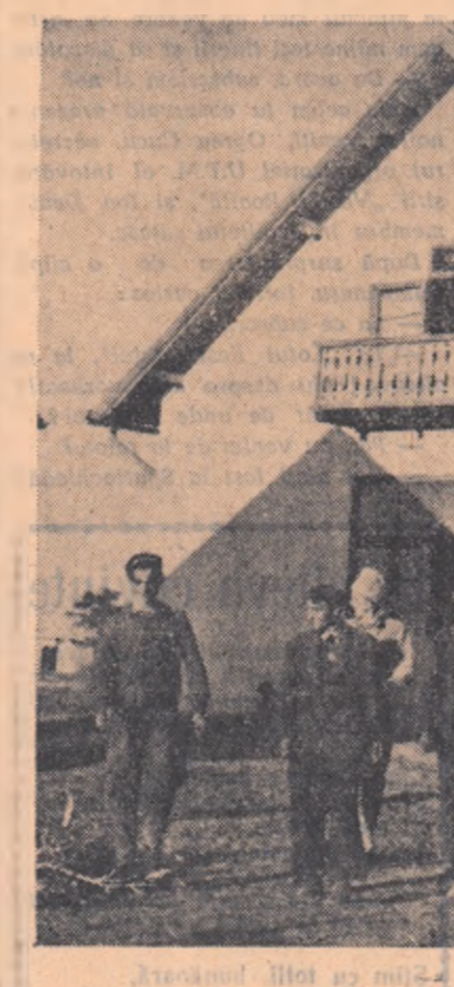
An de an, în gospodăria agricolă de stat Salonta — Oradea sporește numărul construcțiilor menite să asigure lucrătorilor condiții cît mai bune de muncă și de trai. În clădire: noua cantină unde pot lua masa deodată 300 de muncitori.