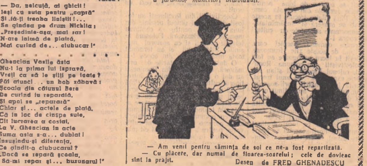
— Am venit pentru sîmțina de sol ce ne-a fost reparată. — Cu plăcere, dar numai de floare-soarelui; cele de dovleac sînt la prajit. Desen de FRED GHEADESCU

Gheoncia Vasile ăsta Nu-l la prima lui ispravă, Vreii ce să le știu pe leată? Păi atunci, un hab zăbavă! Școala dia cîntul Bere De curînd le reparată, Și apoi se reparată... Chiar și... actele de piatră, Că în loc de cișpa sule, Cîi lucrarea a costat, La V. Gheoncia în acle Suma asta s-a... dubiat! Înșugîndu-și diferența, Ce gîndit-a clubucarui? „Doacă se repară școala, Să-măi repa și... buzunarul!”