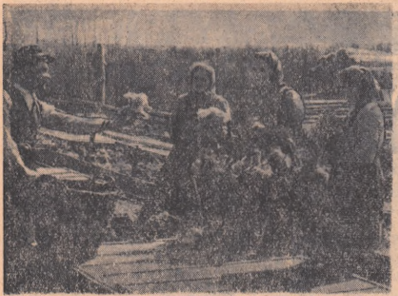
Prin dezvoltarea sectorului legumicol, gospodăriile agricole colective își sporesc în însemnată măsură veniturile. Astfel, aducând pe piața orașelor produse de sezon, colectiviștii din comuna Bors, raionul Oradea, obțin zilnic, numai din vânzarea «altei verzi», peste 1000 de lei. În clipșu: un grup de colectiviști încărcând salata verde în coșuri.