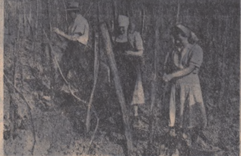
Brigada vitcolă din gospodăria agricolă de stat Sălard, regiunea Ora-dea, execută cu multă atenție tălătuș și legatul viței de vie. În clipșu: un aspect din timpul muncii.