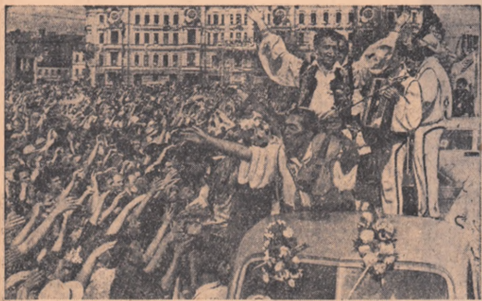
Oamenii sovietici întâmpină cu dragoste pe reprezentanții țării noastre la Festival.