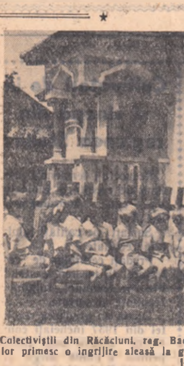
Colectivul din Răcășeni, reg. Bacău, muncesc liniștit pe ogor. Copiii lor primesc o îngrijire atentă în grădinița sezonieră a gospodării lor colective.

șionare a lucrării. Colectivul au reușit să se aie a doua oară. Terețul era curat și au avea nevoie de el de o cultură în raionul Măcin. Ce se întâmplase? Intenția în adevărată măsură aștia nu s-a preocupat să încheie contracte de lucrări pentru primăvară, s-a trasă că, din lipsă de teren nu-și poate realiza planul. Și atunci, conform dispoziției lăvărului Maximilian Climesa, directorul stațiunii, s-a rețut ca metoda ca... cea de mai sus.