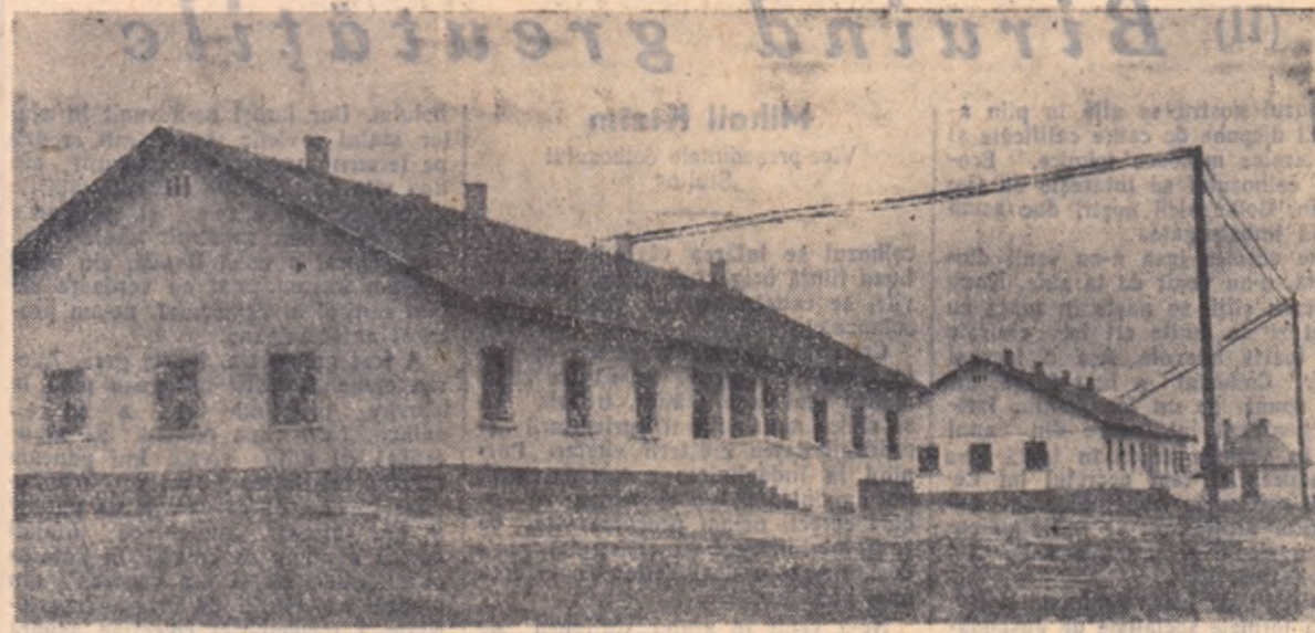
Și la S.M.T. Horia — raionul Hirșova, mecanizatorilor le-au fost create condiții din cele mai bune de muncă și de iral. În ultimul an, aici au fost construite numeroase locuințe, prevăzute cu instalațiile necesare. În fotografie: un nou grup de apartamente pentru familiile care au fost în ultima săptămîna electrificate.