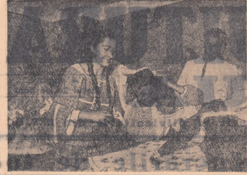
Pe chipurile acestor tinere emoția se împletește cu bucuria... Pe chipurile acestor tinere emoția se împletește cu bucuria...