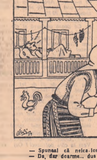
— Spuneai că neica-ion e dus la arat și cînd colo doarme... — Da, dar doarme... dus!

Unii țărani omînd de ară pe mîl-ne arăturile de toamnă.