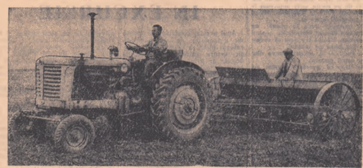
Membrii brigăzii experimentale dela gospodăria agricolă de stat Orșieșoara, regiunea Timișoara, au început însămînțările pe tarilele repartizate lor prin contractul încheiat cu conducerea unității. În fotografie îl vedem pe mecanicul frunțan Ion Iușan, care folosind la maximum capacitatea de lucru a tractorului, a însămînțat în primele două zile 50 de hectare cu grâu.