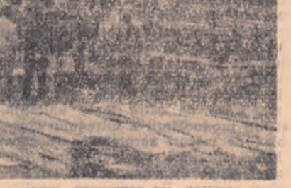
Sera pe care o construiesc colectivitățile din Hălchiu, raionul Călugăreni.