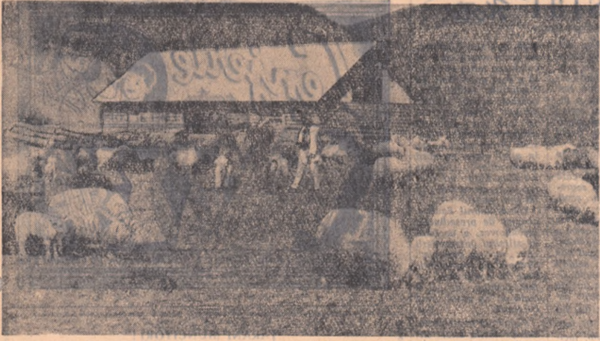
Intovărășirea zootehnică din comuna Breaza, raionul Cluj-Napoca, s-a construit un siloz. Un silozan proprietar al silozului nu arată această întovărășire vor avea curând la o formă nouă, superioară, de cooperare în producția agricolă?