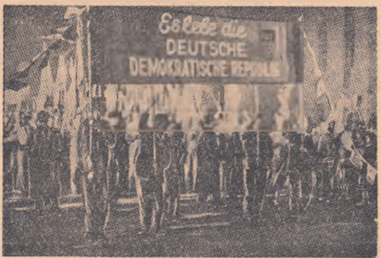
În lumina miilor de torțe, poporul german sărbătorește constituirea Republicii Democratice Germane.

În urma victoriei cauzii anti-hitleriste asupra militarismului german — victorie la a cărei obținere Uniunea Sovietică a dat o contribuție hotărâtoare — în fața poporului german s-au deschis noi perspective. Constituirea R. D. Germane este o mărțurie glorioasă a dorinței poporului muncitor german de a pune pentru totdeauna capăt militarismului.