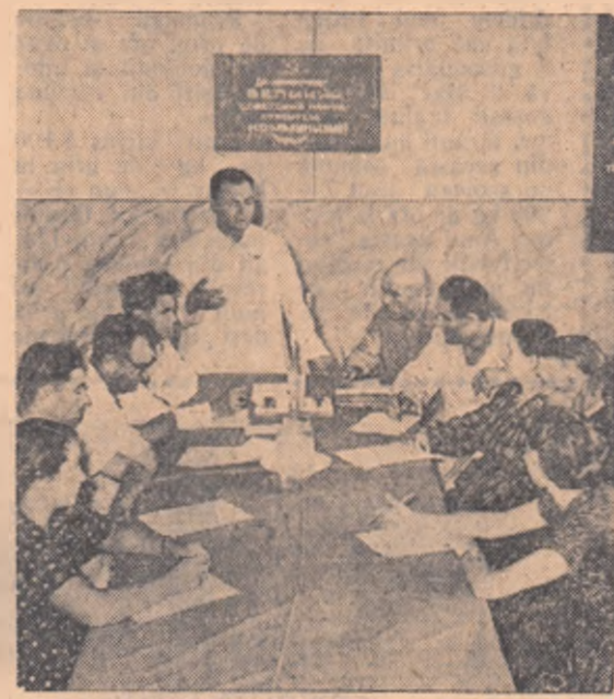
Comitetul de conducere al colhozului „Stalin” în timpul unei ședințe

Comitetul de conducere al colhozului este drept îndreptar în hotărârile Partidului Comunist și ale guvernului sovietic, statului artelului agricol, hotărârile adunărilor generale ale membrilor colhozului și pe acelea ale adunărilor împuțernicite.