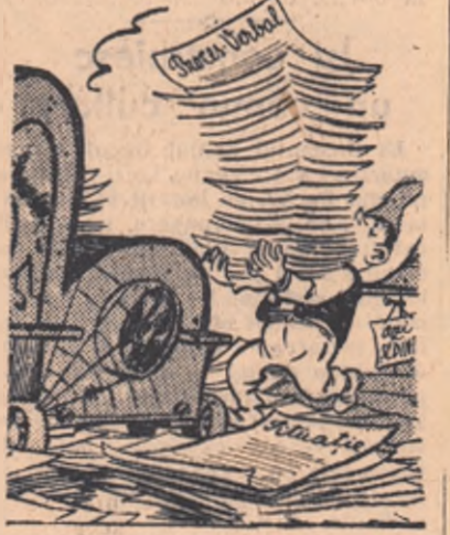
— la vitele cele „țuraje”... Desen de NIC. NICOLAESCU

cut. Rezultatele n-au întîrziat să se arate. La trei zile după colectivizarea comunei Tîndărei în comuna Mihail Kogălniceanu și Săveni sîntuate în apropiere nu a mai rămas nici un om în afara gospodăriei colective. În patru zile ca rezultat al colectivizării comunei Cocargeaua colectivizarea s-a încheiat și în satele Bulgă și Ștefan cel Mare. Din experiența colectivizării raionului Fetești se desprind multe alte învățăminte. ECHEPELE DE AGITATORI AU FOST FORMATE ÎN CEA MAI MARE PARTE DIN COLECTIVISTI FRUNTAȘI. NUMARUL ACESTORA DEPAȘESTE 1.400 DIN TOTALUL CELOR 1.800 DE AGITATORI CÎTI AU ACTIVAT ÎN ÎNTEGUL RAION. Nu le-a fost greu colectivizării agitatorilor din Făcăieni să-l convinză pe întovărășirile din Bordsuani de ce este mai bine în gospodăria colectivă: erau vecini, se cunoșteau de ani de zile. Asemenea lor au muncit la Sudii și colectivizării agitatorilor veniți din comuna Ogoarele. Experiența raionului Fetești s-a folosit și în raionul Tulcea. În două-trei zile colectivizarea în întregime a regiunii Constanța va fi un fapt împlinit. ASTAZI DOAR 0,4 LA SUTA DIN NUMARUL ÎNTOVARĂȘITILOR MAI SÎNT ÎN AFARA GOSPODĂRIILOR COLECTIVE. Oamenii muncii din raionul Fetești se pot mîndri că și ei au participat activ la înfăptuirea aproplatel victorii.