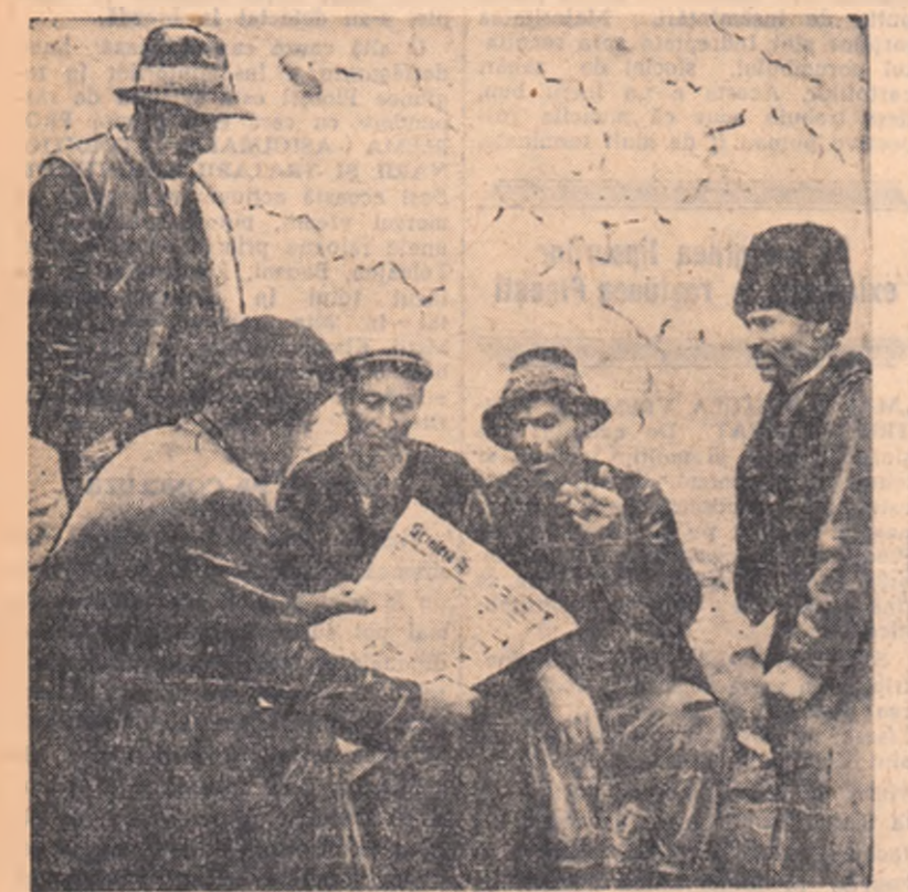
Cu opt ani în urmă a fost luată această fotografie. 6 locuitori ai satului Ion Corvin din jurul așteptării în 3-5 martie. În același an, doi dintre ei au intrat în prima gospodărie colectivă înființată în Dobrogea. De curînd i-au urmat și ceilalți.