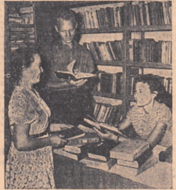
Biblioteca clubului din colhozul „Stalin” este frecventată de un mare număr de cititori.