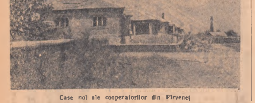
Casa noi ale cooperativei din Pirvenet

Spre deosebire de alte cooperative din R. P. Bulgară, la împărțirea veniturilor cooperativei din Pirvenet da cooperativiștii numai bani. În natură se dă numai ceea ce (lămurăte sau un litru de vin pentru fiecare zi-muncă).