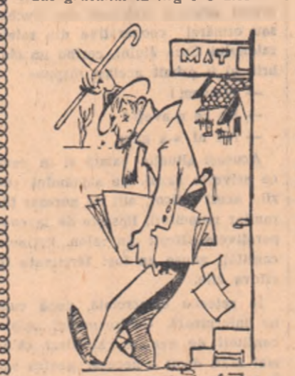
(Desen de N. CLAUDIU)

Deunăzi, după ce am gătit de semănat grîul, mi-am luat tralasta și bățul și am plecat la sja, la Adincata. Asemă neonic să scot un certificat pentru ca să duc grăsunul la Tirgul Urzicenilor.