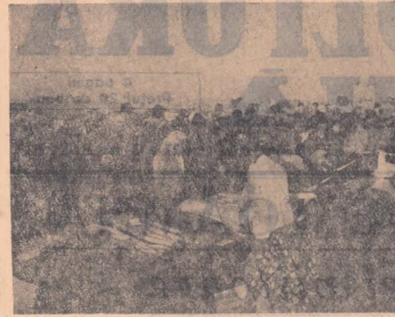
La tirgul săptămînal din comuna Olteni, raionul Olteni, produsele U.R.C.C. Vîrtoapele se bucură de mare succes în rîndurile țărânilor muncitori.