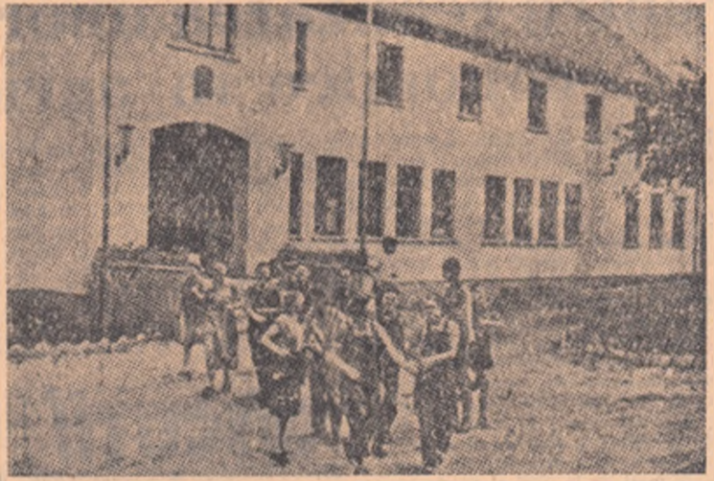
La gospodăria de stat „Schöngeln” (regiunea Gera) învață un student volos. Una dintre cele mai frumoase clădiri aparține tineretului stiner de la țară: Combinatul de învățămînt agricol „Philipp Müller”.

GRIJA PENTRU CALIFICAREA TINERETULUI ÎN R. D. GERMANĂ