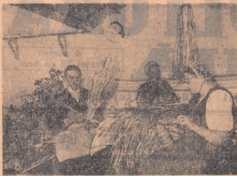
În comuna Cisnădoara, raionul Sibiu, țărani muncitori priceputi în arta împletiturilor de pal folosesc din plin zilele cînd nu pot lucra la cîmp. Execuții în loturile de artă pe sticle și damigene.