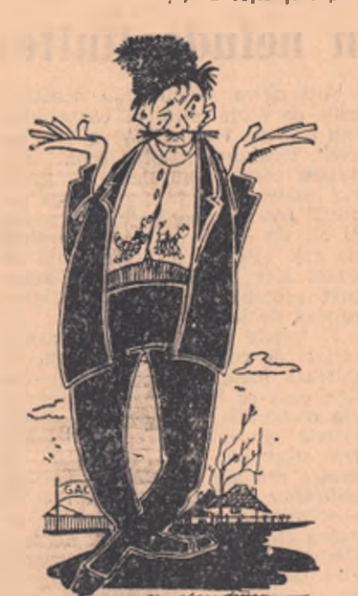
— Să mai aud pe cineva că eu nu lupt împotriva... „familiașismului”.

Mal sînt unii săteni care se înscriu singuri în gospodării colective, fără soție și copii.