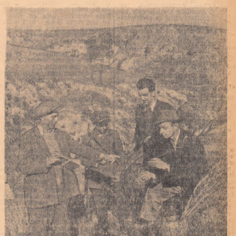
O echipă de silvicultori din regiunea Galați delimitază sectoarele unde, conform planului stabilit în cadrul campaniei de împăduriri, vor fi plantați puieții.