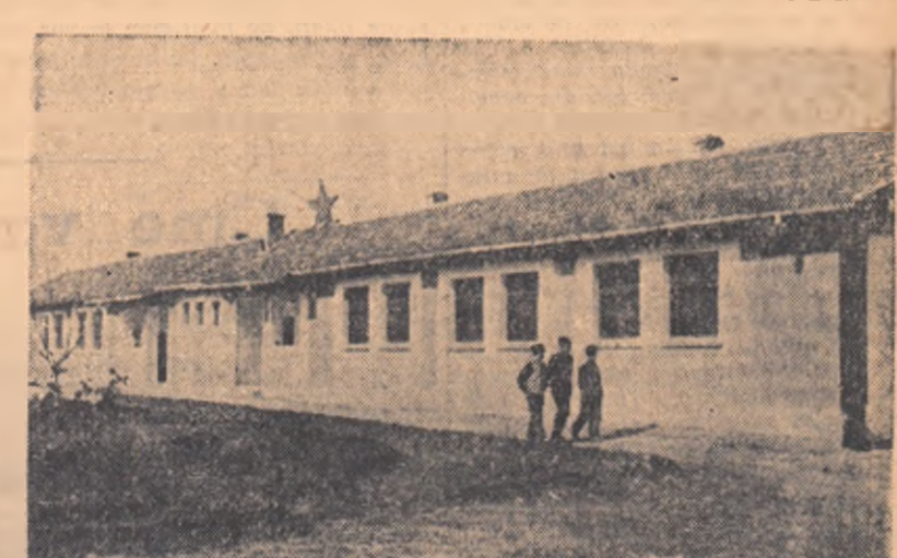
Muncitorii care lucrează în gospodăria agricolă de stat II se creează condiții tot mai bune de cazare. În fotografie: un dormitor de la gospodăria de stat „30 Decembrie”, regiunea Galați, cu mai multe camere, în care pot fi cazaj 80 de muncitori.