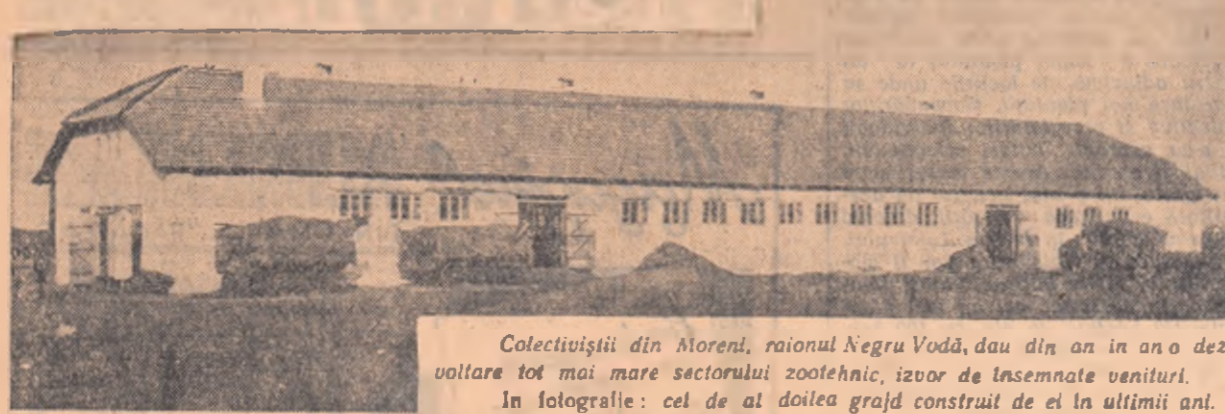
Colectivizii din Moreni, raionul Negru Vodă, dau din an în an o dezvoltare tot mai mare sectorului zootehnic, izvor de însemnate venituri. În fotografie: cel de al doilea grajd construit de ei în ultimii ani.