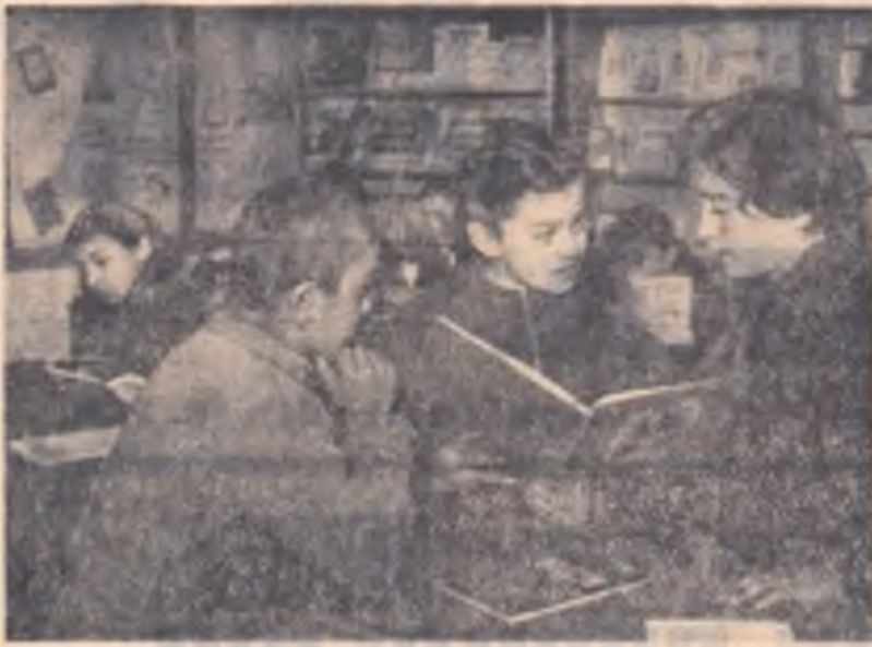
La biblioteca cîminului cultural din comuna Răcăciuni, regiunea Bacău

Intreabă Sanda, ca mai mare: — Ce-al vrea, Lenușo, să citești? — Cam grea-l alegerea, se pare: — Aș vrea o carte... cu povești.