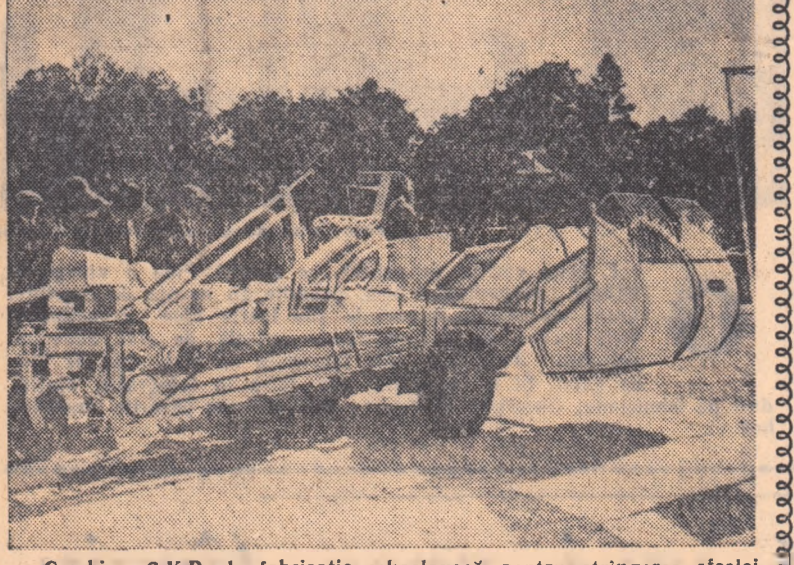
Combina S.K.R. de fabricație cehoslovacă pentru stringerea steclei. Într-o oră ea recoltează stecă de zahăr de pe cea. 0,8 ha.