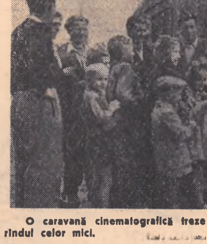
O caravană cinematografică trece pe întotdeauna interes. Chiar și în rîndul celor mici.

Bucurosa de întrebare, distinsul intelectual din satul dintre dealuri mi-a explicat că membrii cooperativei plătesc anual cîte 100 de zloti. Cooperativa primește însă unele fonduri bănești și de la organizația economică superioară „Ajutorul țăranului”. Bolnavii-membri ai cooperativei de să-