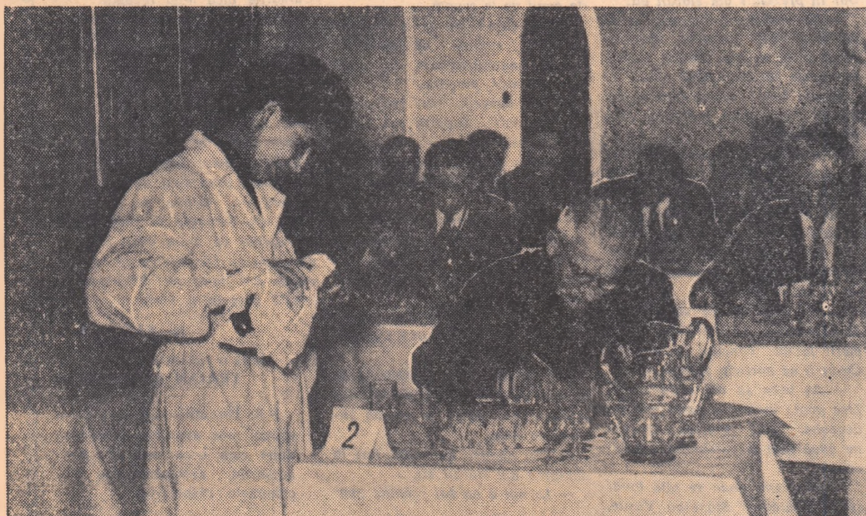
La 26 ianuarie a.e. în sala Bibliotecii Institutului de Cercetări Horti-viticole București-Băneasa, a început primul concurs republican de vinuri. În primele două zile au fost degustate peste 140 de probe din cele 340 trimise. Cel mai mare punctaj a fost obținut pînă acum de probele cu nr. 88, 70, 78, 99 și 100. Ce probe vor obține diplome și medalii și ale cui sînt vom vedea abia la sfîrșitul concursului. În fotografie: un aspect din timpul degustării.