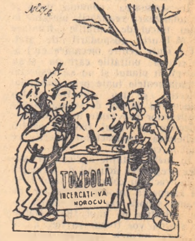
Doar așa, pe cit se pare, Fără nici o supărare. Piesele solicitate. Vor fi just... repartizate... Desen de NIC. NICOLAESCU

Din cauza lipsei de piese de schimb, la S.M.T. Poiana Mare, raionul Calafat, reparațiile mașinilor agricole sînt mult rămase în urmă.