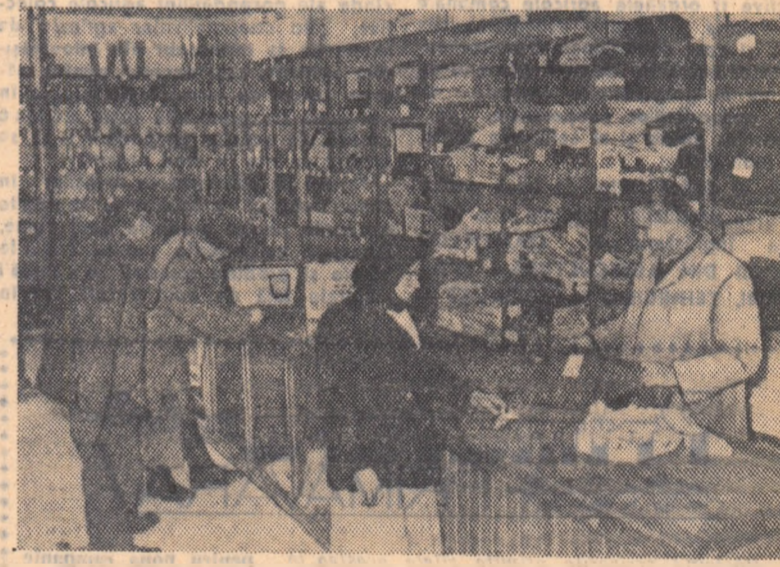
De curînd, în comuna Mihăilești, din raionul Domnești, s-a deschis un nou magazin al cooperativei de consum. După cum se vede în fotografie raturile magazinului sînt încărcate cu mărfuri de tot felul. Așa că țărăni muncitorii din comună se pot mîndri cu cooperativa lor?