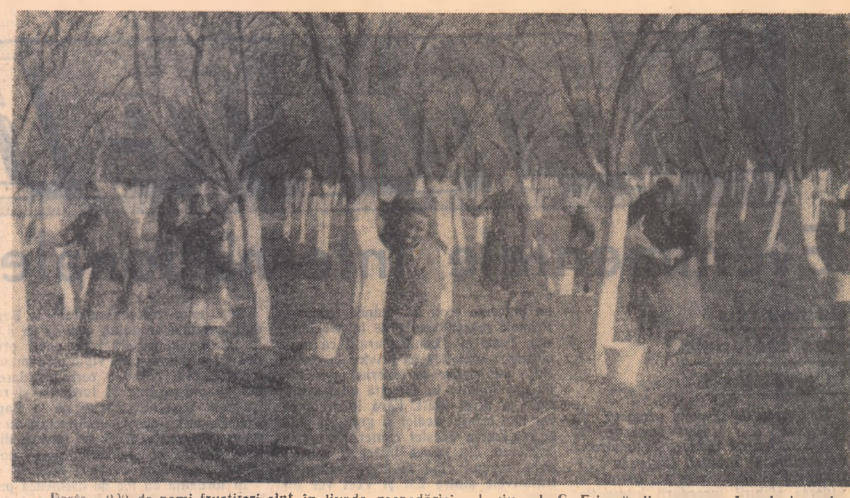
Peste 1.000 de pomi fructiferi sînt în livada gospodăriei colective „I. C. Frimu” din comuna Leordeni, regiunea Pitești.

Merita a fi arătată și hotărîrea privind ajutorarea colectivităților bolnavi. Aceștia primesc timp de doi ani ajutor de la colectivă, iar după 2 ani nu s-au vindecat de boală, vor fi pensionați ca și bătrîni.