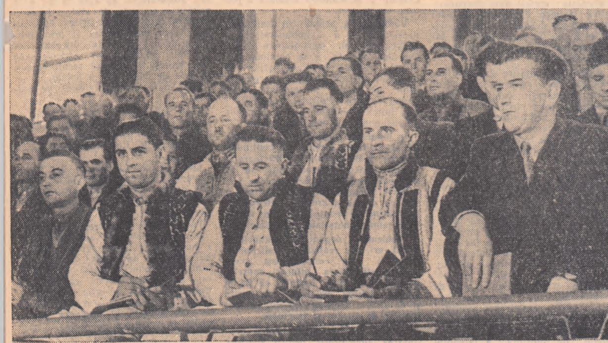
Delegații urmăresc cu atenție încordată deslășurarea lucrărilor Constituției.