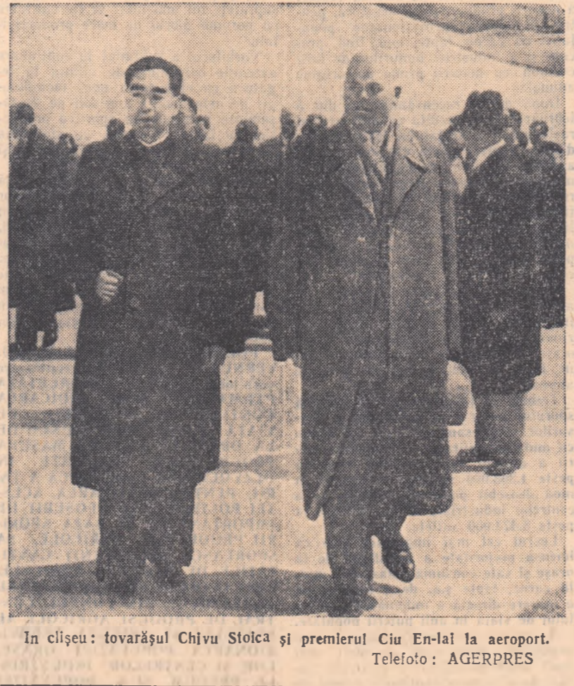
În clăuse: tovarășii Chivu Stoica și președintele Ciu En-lai la aeroport.

doi popoare. În cuvântul de răspuns, tovarășii Chivu Stoica a exprimat profunda bucurie a membrilor delegației pentru prilejul oferit de a cunoaște munca și lupta eroicului popor chinez și realizările sale. În după amiaza zilei, oamenii de stat români au avut o întrevedere cu Ciu En-lai, după care au făcut o vizită la Ministerul Metalurgiei. Seara a avut loc o recepție, în cursul căreia au rostit cuvântări tovarășii Ciu En-lai și Chivu Stoica.