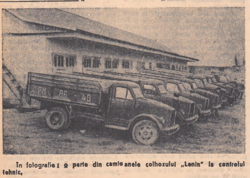
În fotografia de parte din camioanele colhozului „Lenin” la control tehnic.