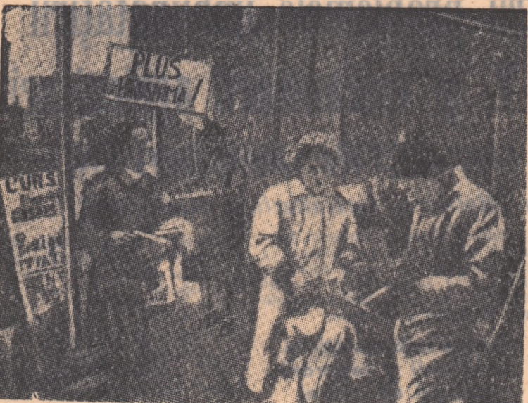
„Niciodată Hiroșima”, „Încetați experiențele cu arma nucleară”, iată câteva din lozincile ce pot fi văzute la mișturile ce au loc în aceste zile în întreaga Franță.

În întreaga lume, oameni de diferite profesii, împărțind diverse concepții, se unesc și își ridică cu hotărâre glasul împotriva experiențelor nucleare, împotriva primejdiei atomice. Dându-și seama de urmările groznice ale unui eventual război atomic, ei se ridică nu numai în apărarea propriei lor vieți, ci și a tot ceea ce civilizatia umană a realizat cu atita trudă. Prin amploarea ei și prin diversitatea forțelor pe care le mobilizează, această mișcare de protest nu-și are seamă în istoria omenirii.