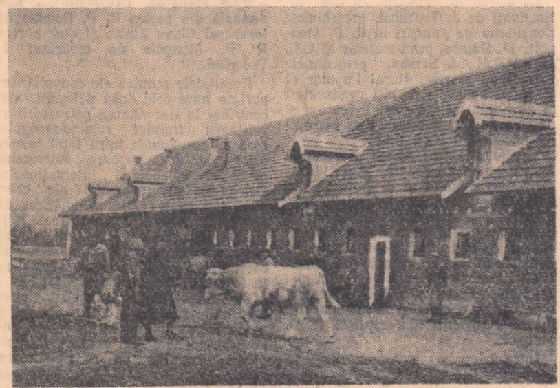
Grajdul din fotografie, construit la gospodăria colectivă Maieruș, regiunea Stalin, poate adăposti 100 de viței și tineret taurin.