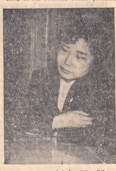
la marginea orașului. La cifra kilometrii, părții nu mă mai recunoșteau. Eram complet desfigurată. M-a cuprins desăzădejde.

bucăți. Pielea mi se desprindea de pe carne. Îmi cădea părul. Singele îmi curgea din toate răniile... Cînd m-am reîntors acasă (locuiam