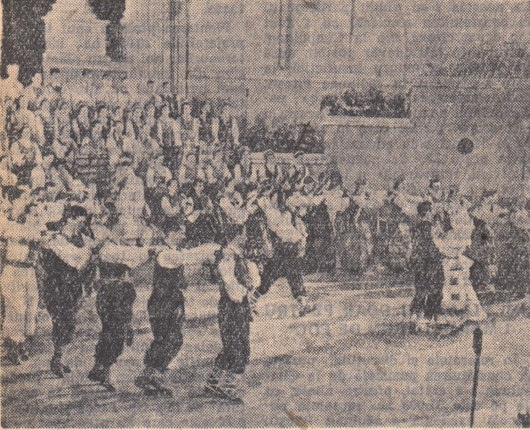
La 1 iunie a început în întreaga țară Decada culturii Republicilor Sovietice Baltice organizată de A.R.L.U.S. Sărbătorile a culturii și prieteniei. Decada este o expresie a dorințelor poporului român de a cunoaște îndepărtate țări și întâmplările a țării dintre republicile sovietice surori. Ea constituie totodată o puternică afirmare a legăturilor de nezdruclinat dintre popoarele țărilor noastre. În fotografie: Un aspect de la spectacolul prezentat de Ansamblul emigrat de stat de cîntece și dansuri populare lituaniene, care ne vizitează țara cu prilejul Decadel.