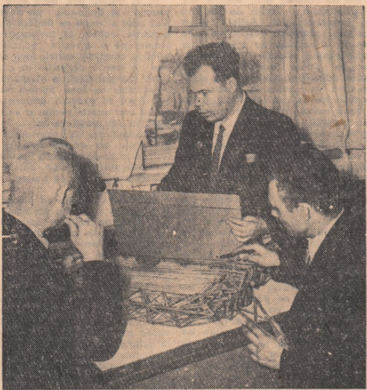
Un grup de constructori de mașini discută asupra modelului unei noi mașini agricole, care va fi dată în producție la uzina de mașini agricole din Rostov.