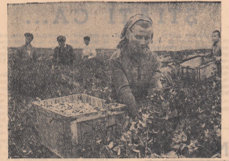
La gospodăria agricolă de stat „Dunărea”, raionul Brăila, recoltatul mazărei este în toi