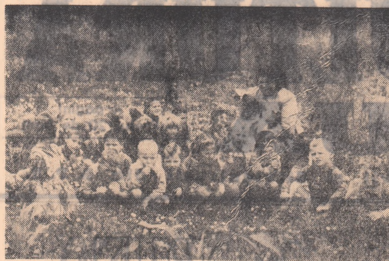
Copiii colectivștilor din comuna Lovrin se pregătesc să asculte poveștea pe care le-a promis-o educatoarea lor. Iar după aceea... somnul va veni mai ușor.