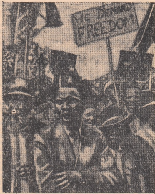
Manifestație de masă în parcul din Johannesburg împotriva politicii rasiste a guvernului Uniunii Sud-Africane

Pentru populația neagră, faptul că la alegerile generale din 16 aprilie 1958 a venit la cîrmă țării partidul naționalist, a însemnat o nouă condamnare pe timp de 5 ani la muncă forțată și infometare. Membrii acest-