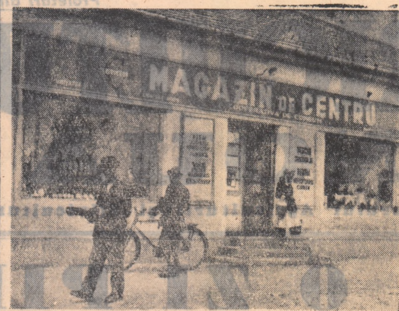
Frumos ca înfățișare și bine aprovizionat cu mărfuri, noul magazin al cooperativei de consum din Borș, regiunea Oradea, este pe drept cuvînt o mîndrie a oamenilor din această comună.