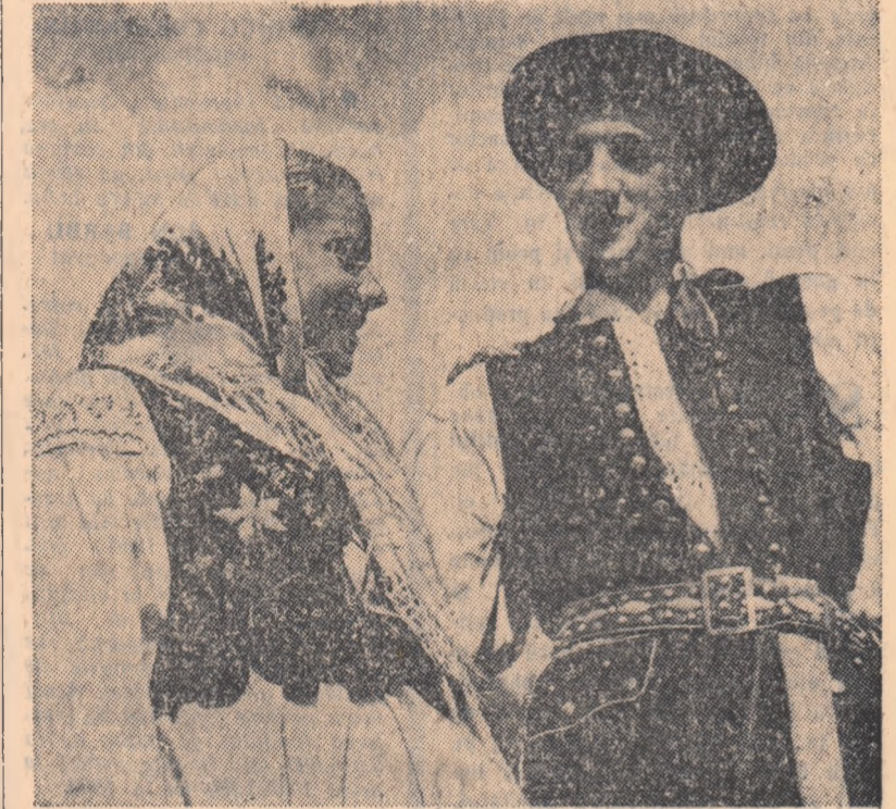
Tineri țărani polonezi din regiunea Nowego Sacza, în frumosul lor port național

Partidul Muncitoresc Unit Polonez se preocupă totodată de dezvoltarea producției agricole, făcîndu-se pași însemnați pe calea mecanizării agriculturii. Cu toate că producția agricolă actuală depășește pe cea dinainte de război, ea încă nu poate acoperi ne-