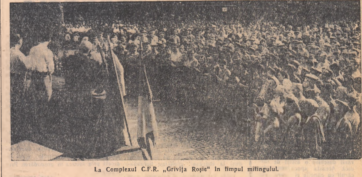
La Complexul C.F.R. „Grivița Roșie” în timpul mîningului.