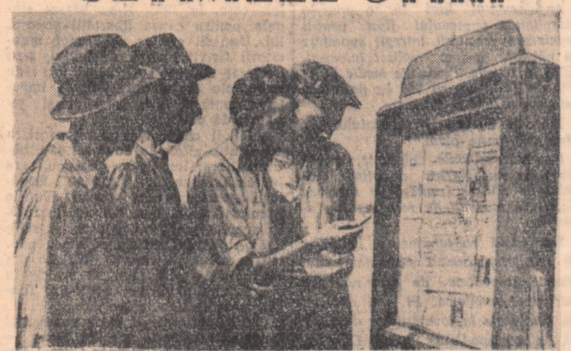
Pe aria comunei Vida din regiunea București, s-a instalat un panou în care ziarul este zilnic schimbat. În pauza de prînz, țărani muncitori vin și citeșc aici ultimele știri.