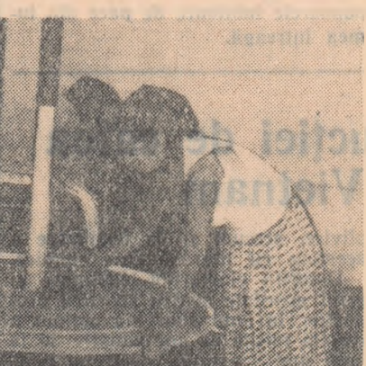
In fotografie: un aspect din timpul curățirii preselor la G.A.S.-Săhăteni

Paralel cu pregătirea utilajului vinicol, o deosebită grijă se acordă în gospodăria de stat Valea Călugărească instruirii pionierilor care conduc direct procesul tehnologic