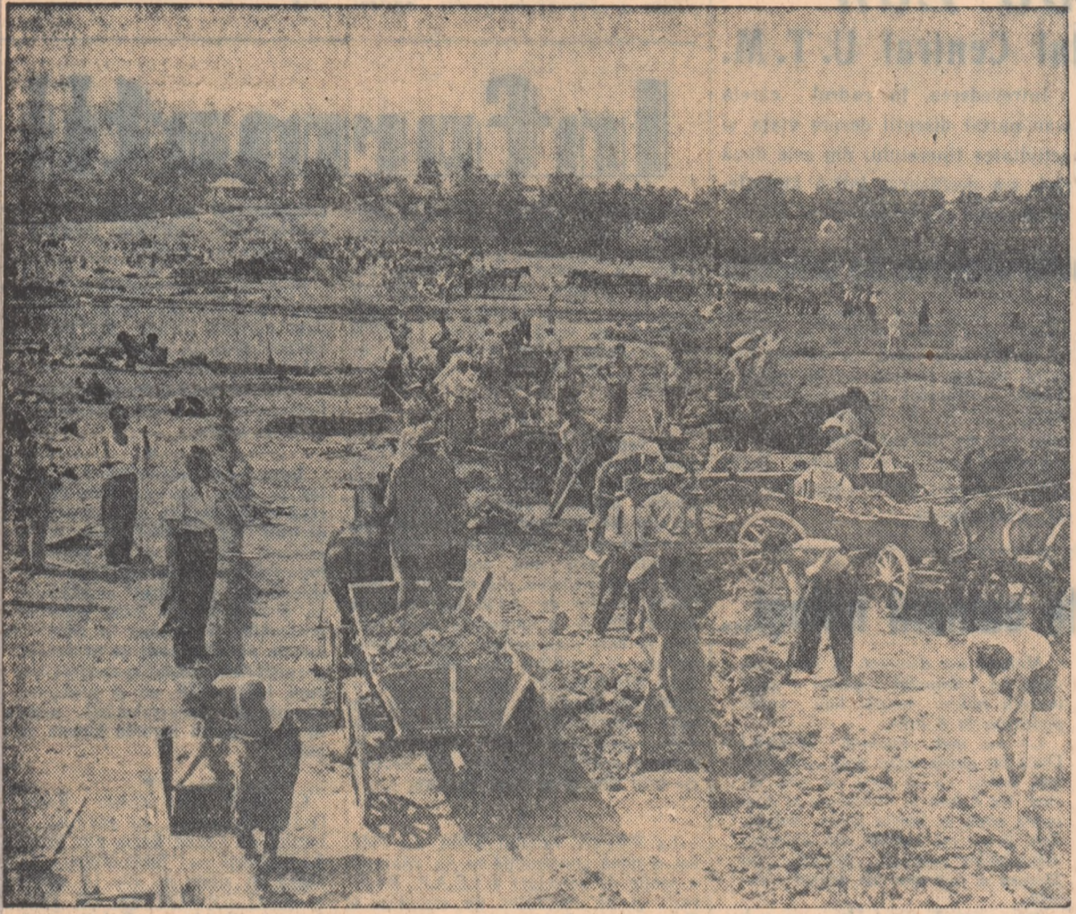
În ultima vreme, lunca Cernica-Căldăraru, regiunea București, s-a transformat într-un adevărat șantier. Sute de oameni, țărani muncitori din comunele Brănești, Cernica, Plătărești, Bălăceana, etc., muncitori și funcționari ai întreprinderilor și instituțiilor din Capitală — muncesc cu elan pentru a pune stăvilă apelor Colentinei, care prin revărsare fac necultivabilă o întinsă suprafață de teren. Prin îndiguirea apelor Colentinei, vor fi redate agriculturii 500 hectare de teren.